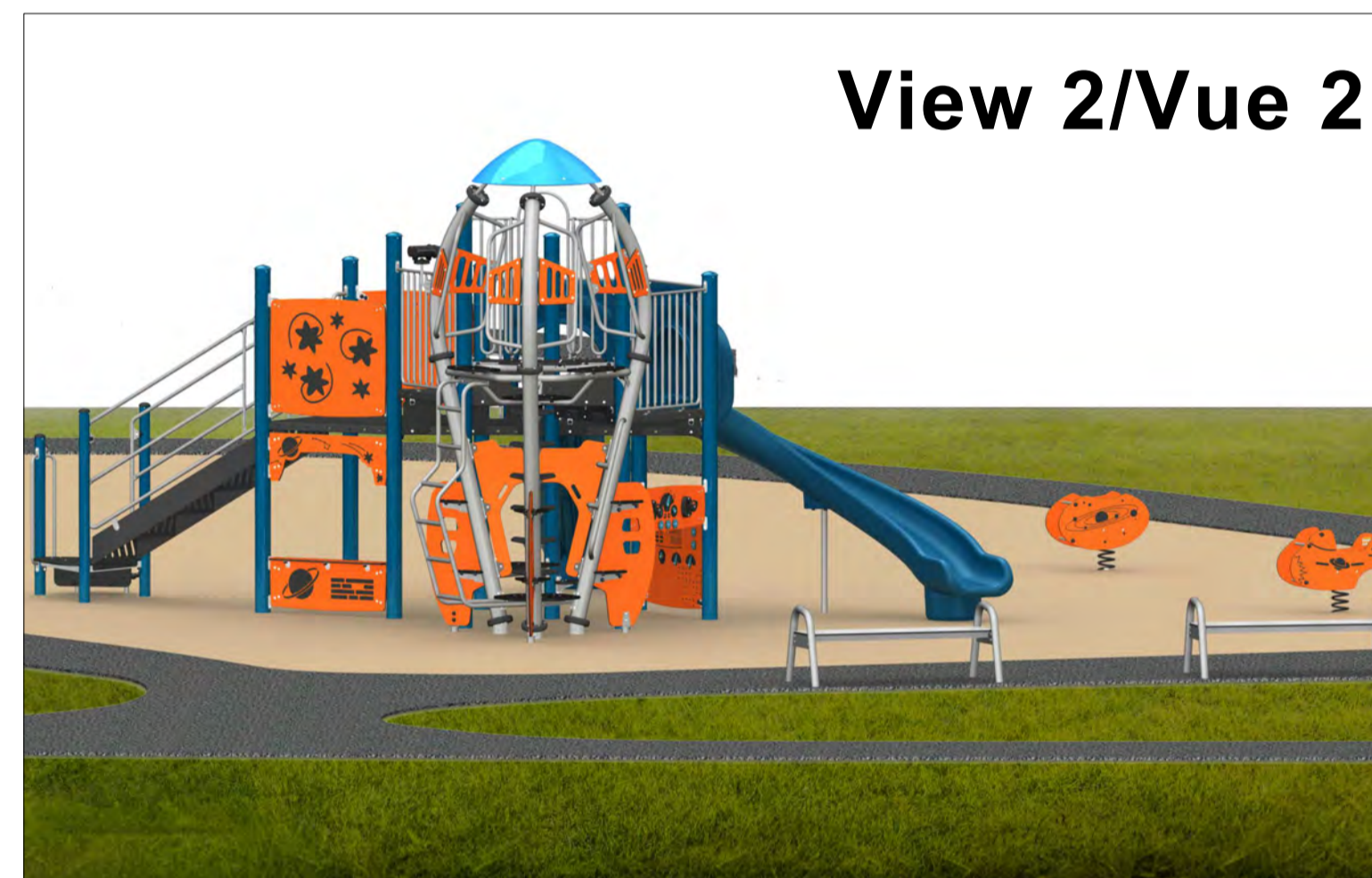
View 2/Vue 2

PLAY STRUCTURE : 2-12 YEARS OLD STRUCTURE DE JEUX: 2 À 12 ANS