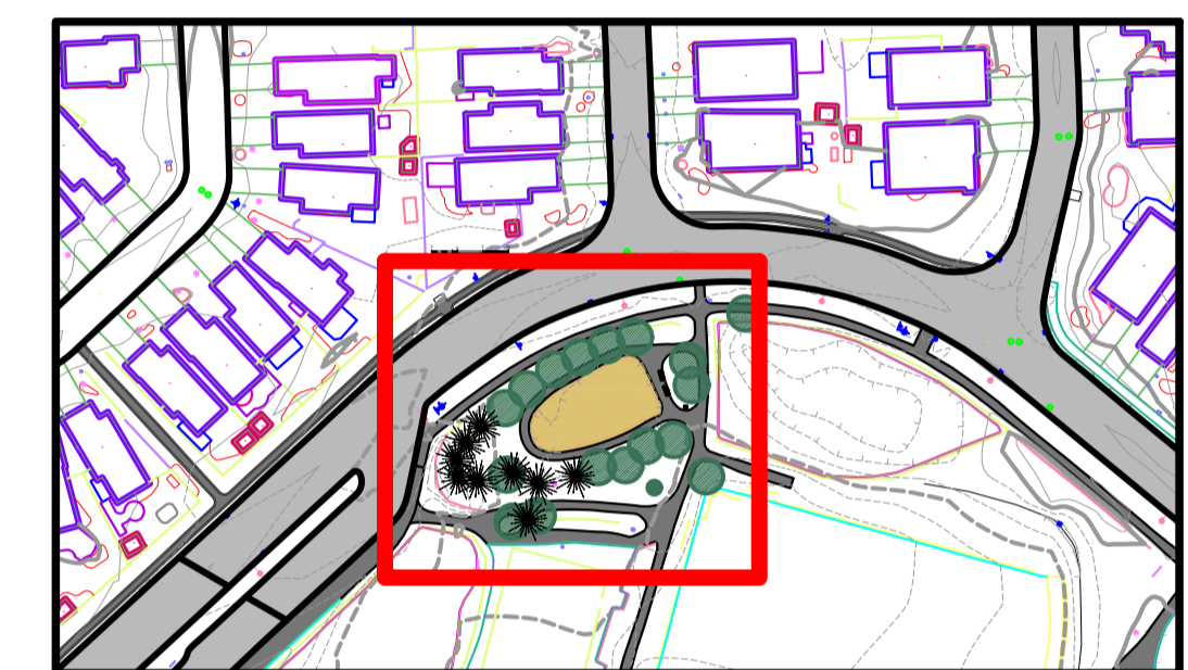
LIMIT OF CONSTRUCTION LIMITES DES TRAVAUX DE CONSTRUCTION