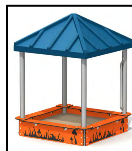
SANDBOX CARRÉ DE SABLE

PLAY STRUCTURE : 2-12 YEARS OLD STRUCTURE DE JEUX: 2 À 12 ANS