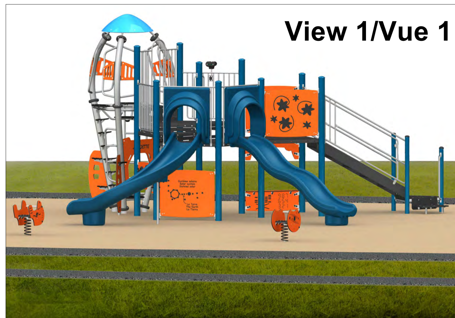
View 1/Vue 1