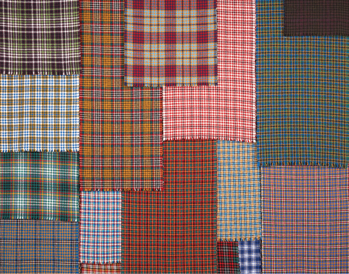
Carl Stewart, clò mòr (detail/détail), 2022, hand-woven and hand-dyed wool / laine tissée et teinte à la main, 274 x 83 cm, photo : Lawrence Cook