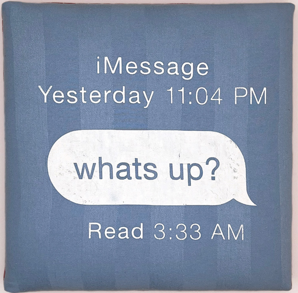
Sam Loewen, (left/à gauche) Pillow Boyfriend with Pearl Necklace , 2022, screenprint on bedsheet, foam, and upholstery tacks on wood panel / sérigraphie sur drap, mousse et brochettes de rembourreur sur panneau en bois; (right/à droite) A Twilight Tragedy , 2022, screen print on bedsheet, foam on wood panel / sérigraphie sur drap, mousse sur panneau de bois, variable dimensions / dimensions variables