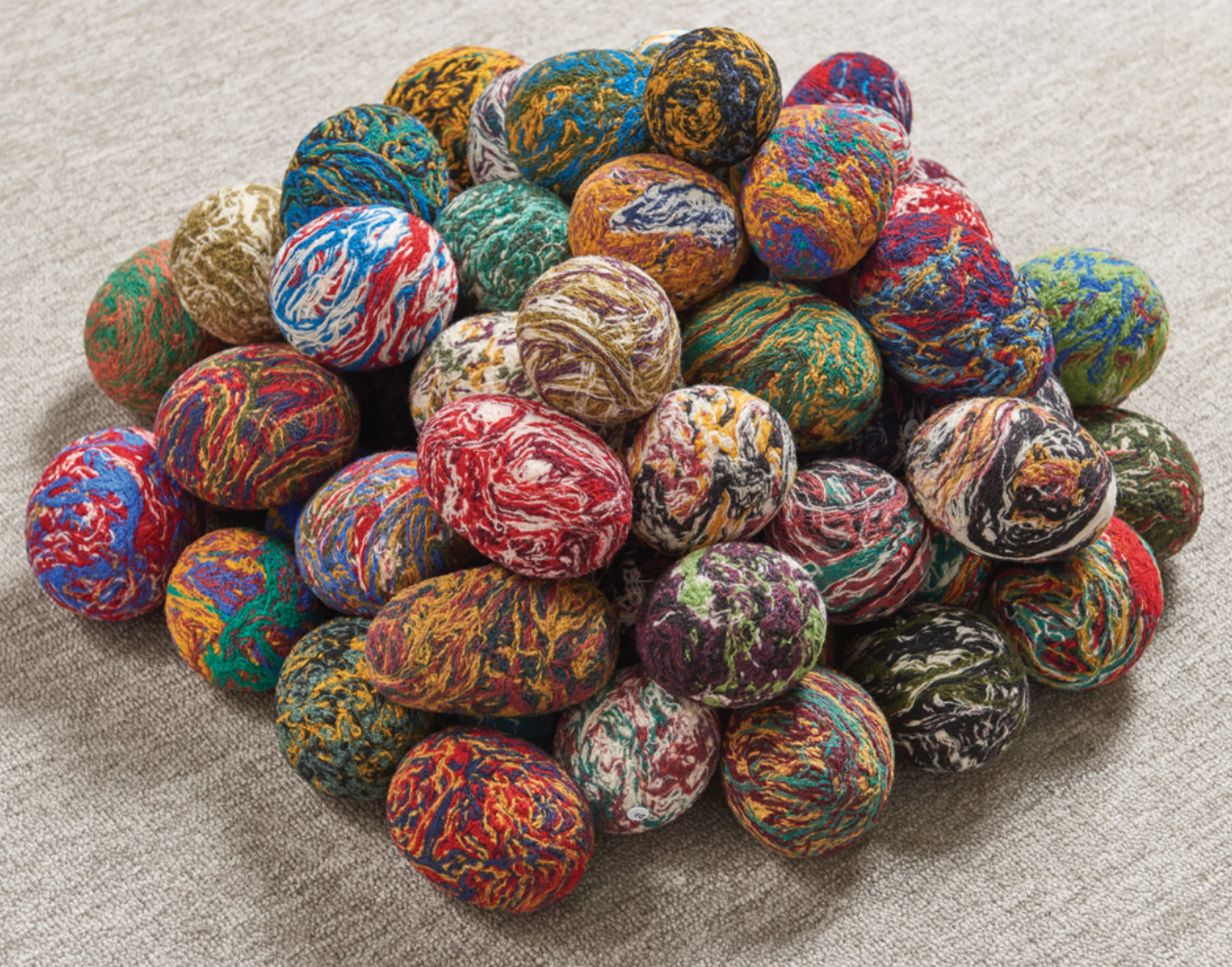
Carl Stewart, càrn , 2021, needle felted and hand-dyed wool / laine tissée et teinte à la main, variable dimensions / dimensions variables