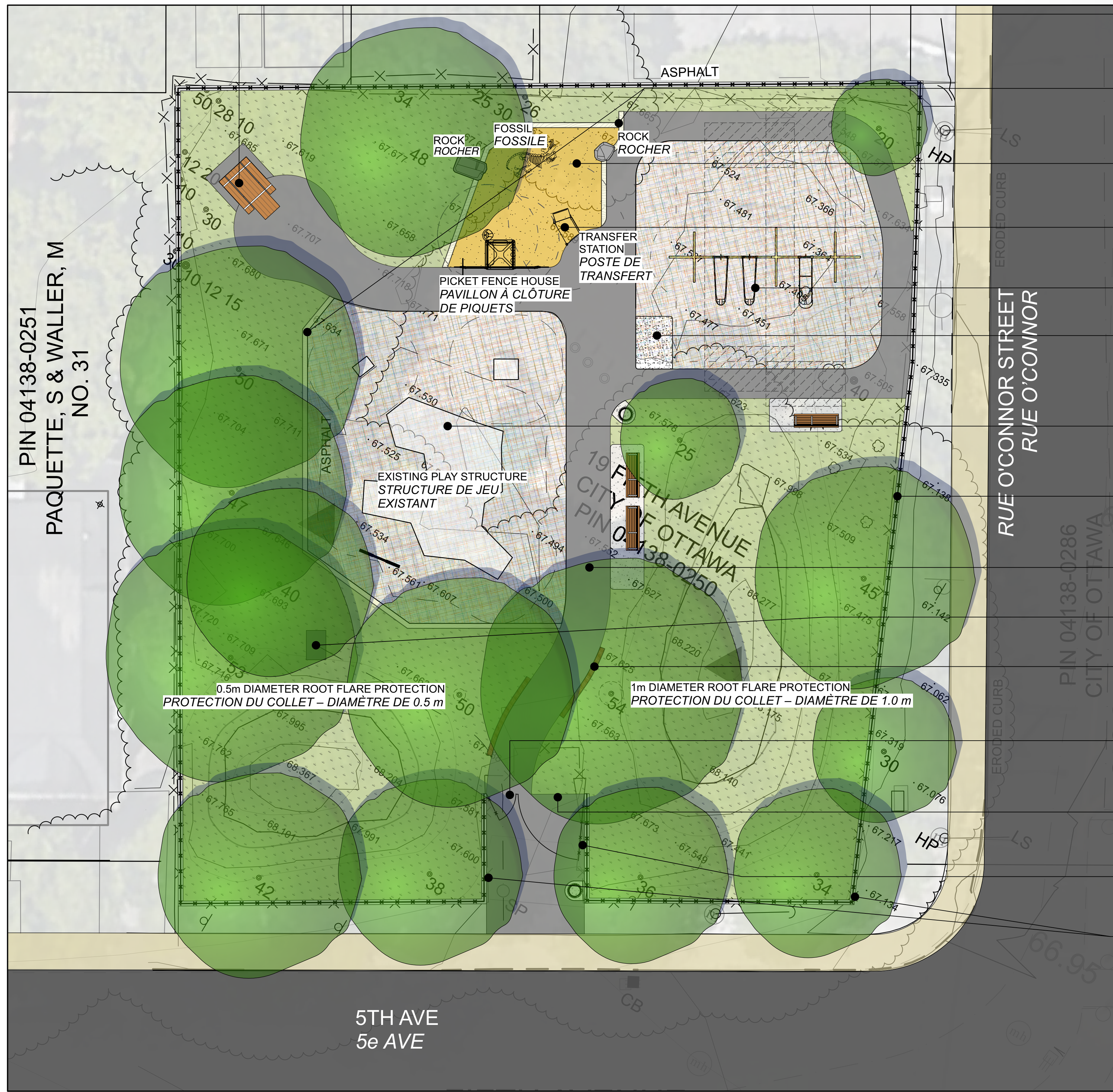
LAYOUT PLAN PLAN D'IMPLANTATION