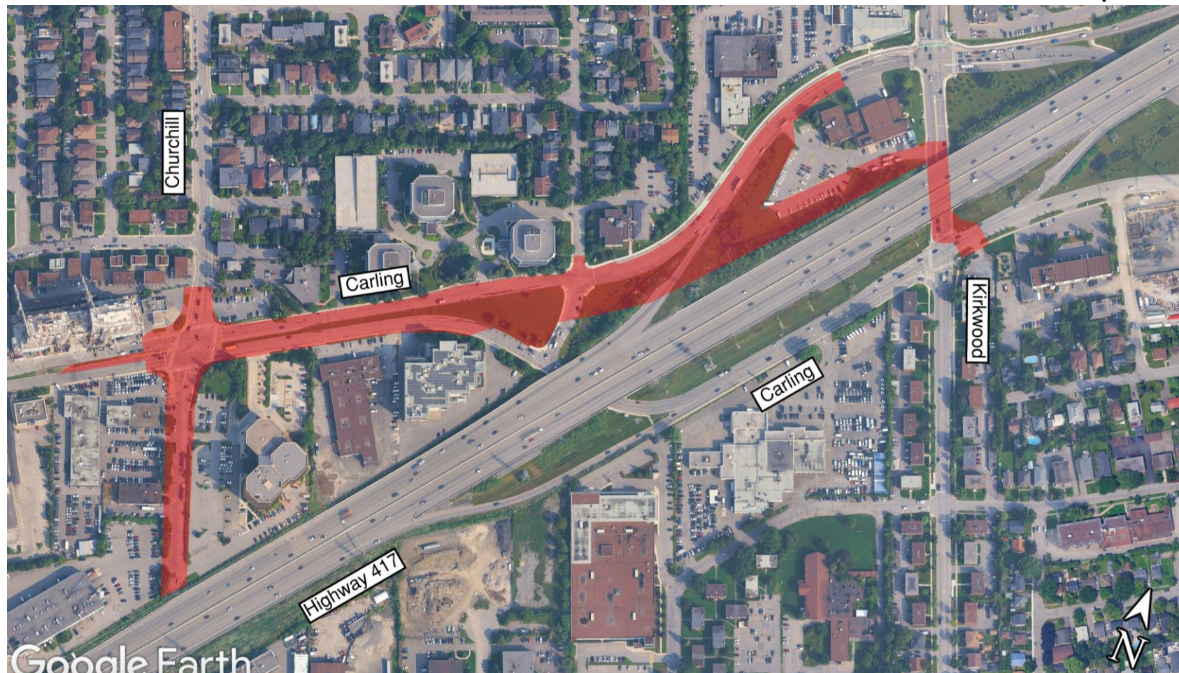
Storm sewer bulkhead removal locations / Emplacements des cloisons d'égouts pluviaux à enlever