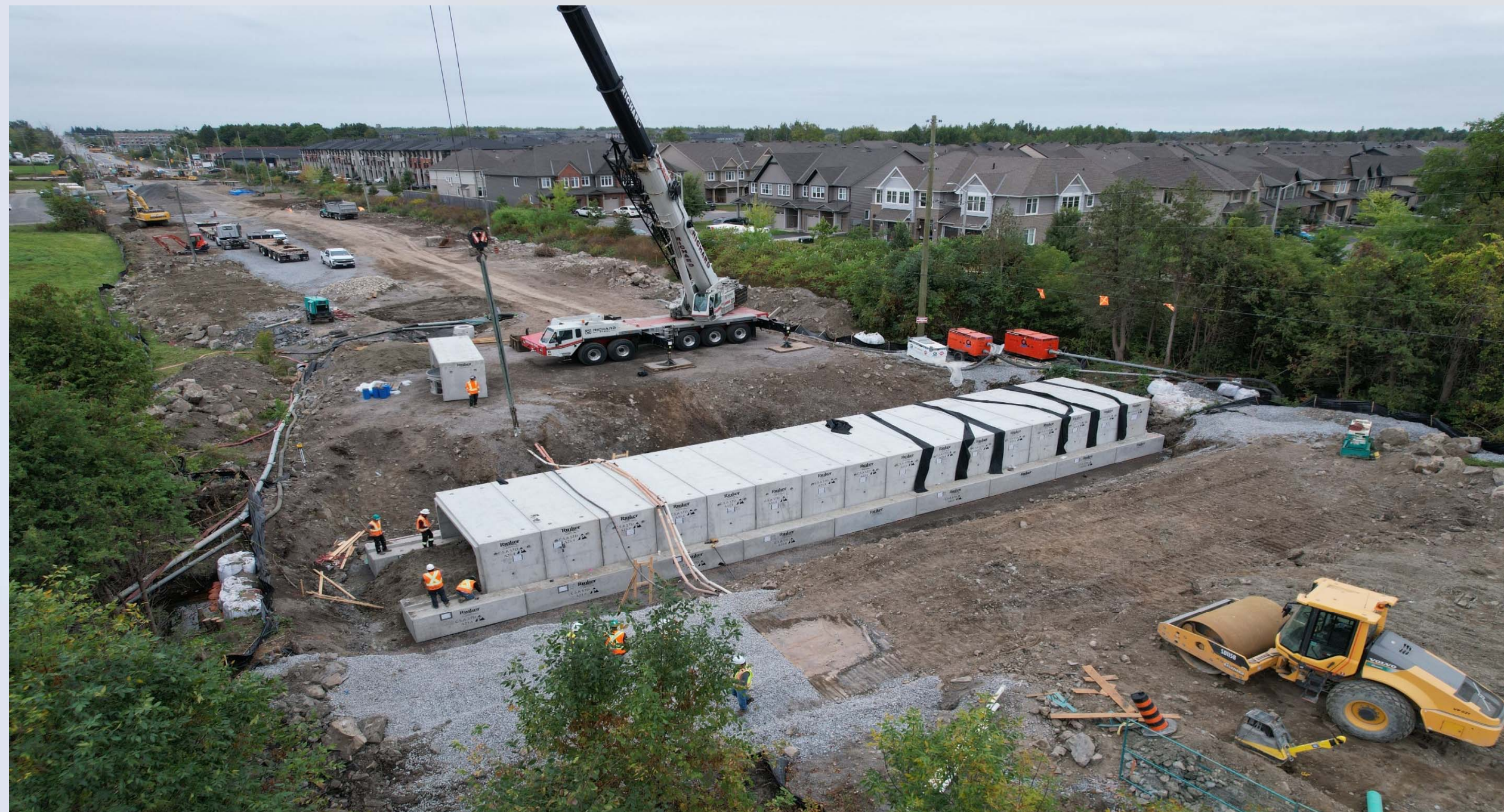
Findlay Creek Culvert installation Installation d'un ponceau sur le ruisseau Findlay