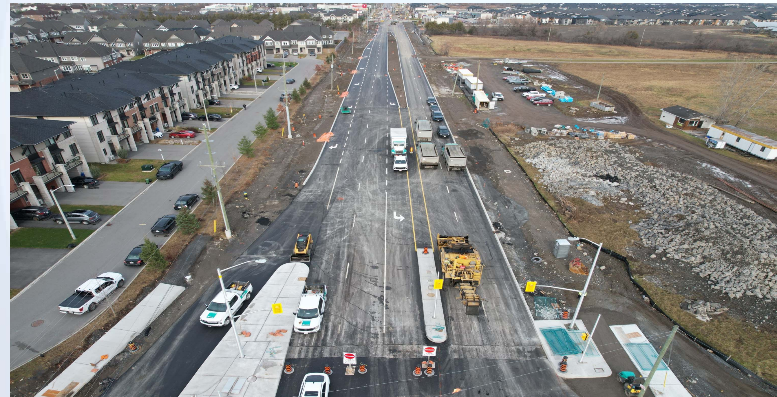
Bank Street—Widened road constructed, final preparations before reopening Rue Bank—Chaussée élargie; derniers préparatifs avant la réouverture