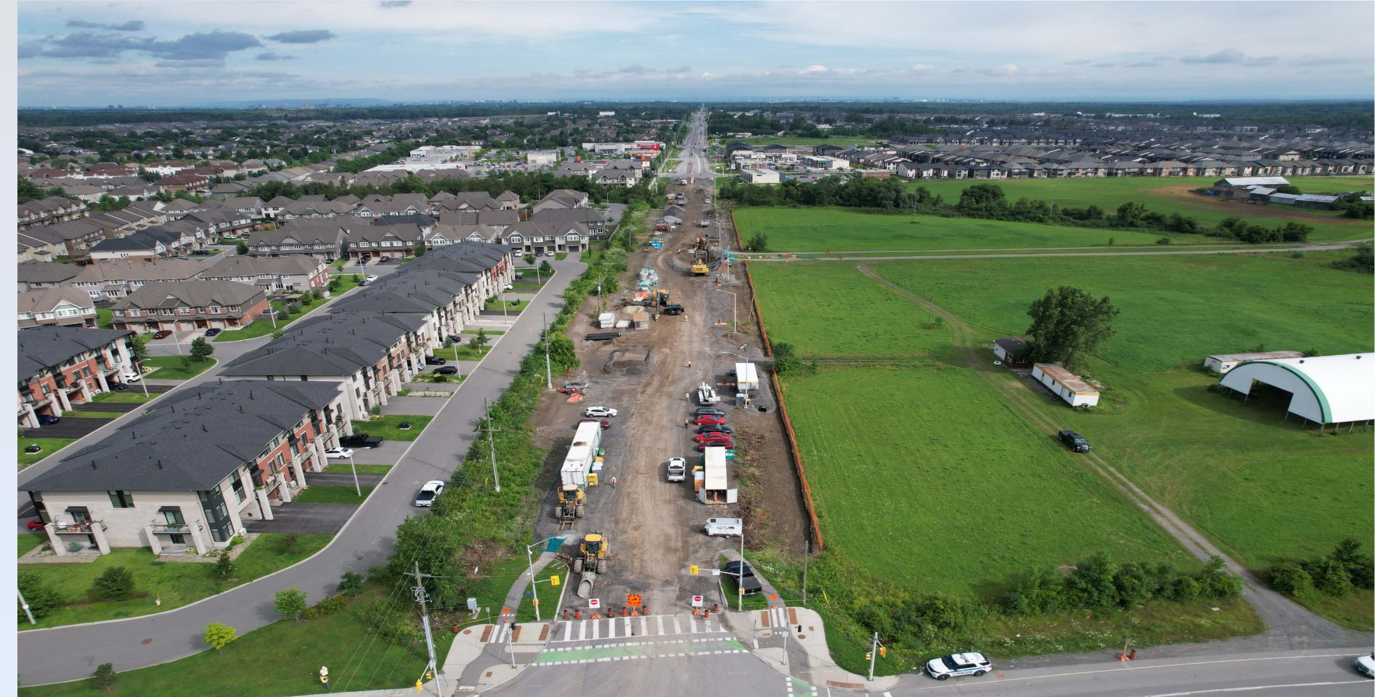
Bank Street — Underground infrastructure installation (road closure) Rue Bank — Installation d'une infrastructure souterraine (fermeture de la rue)