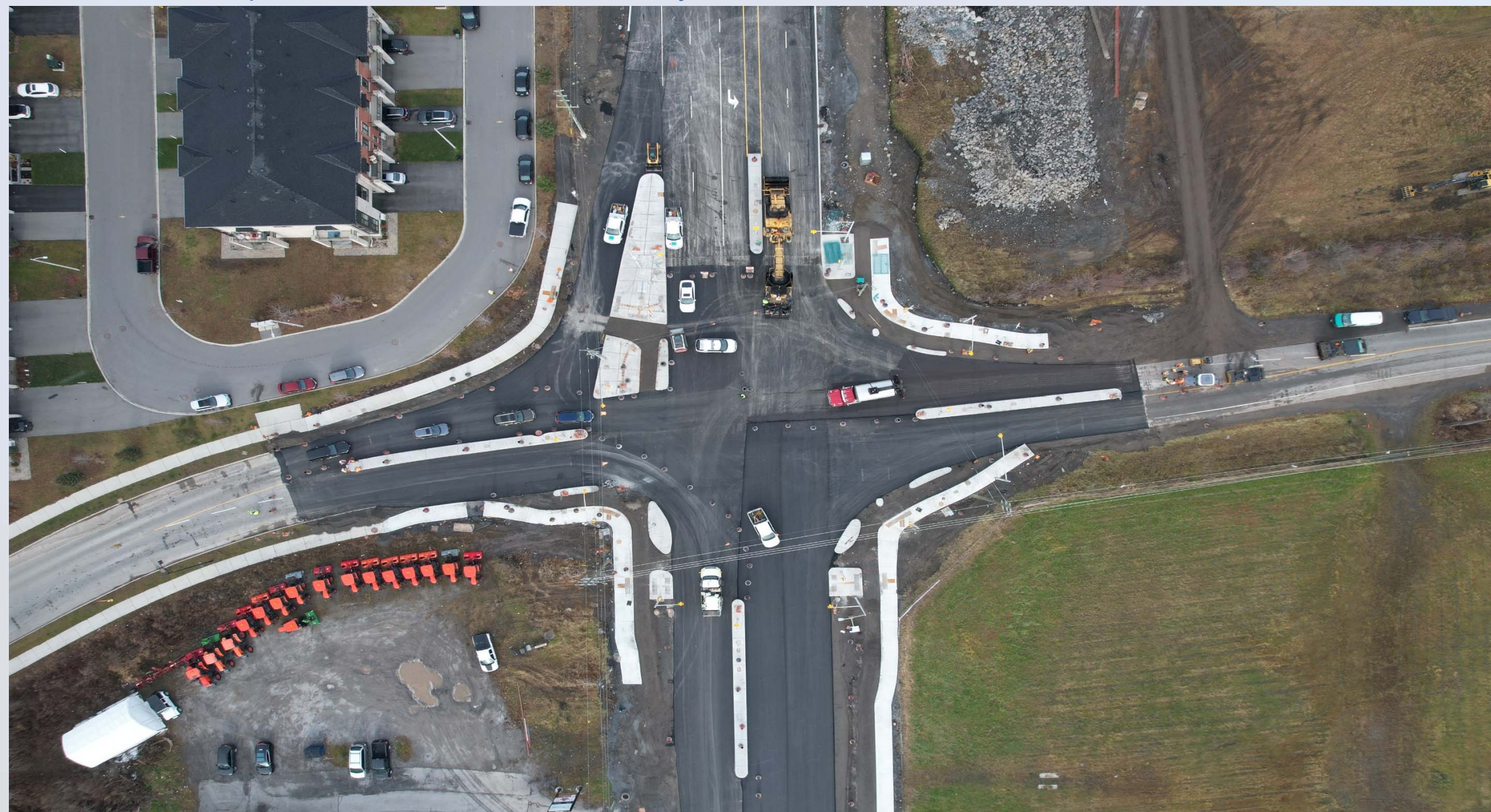
Bank and Blais/Miikana Intersection Intersection de la rue Bank et des chemins Blais et Miikana