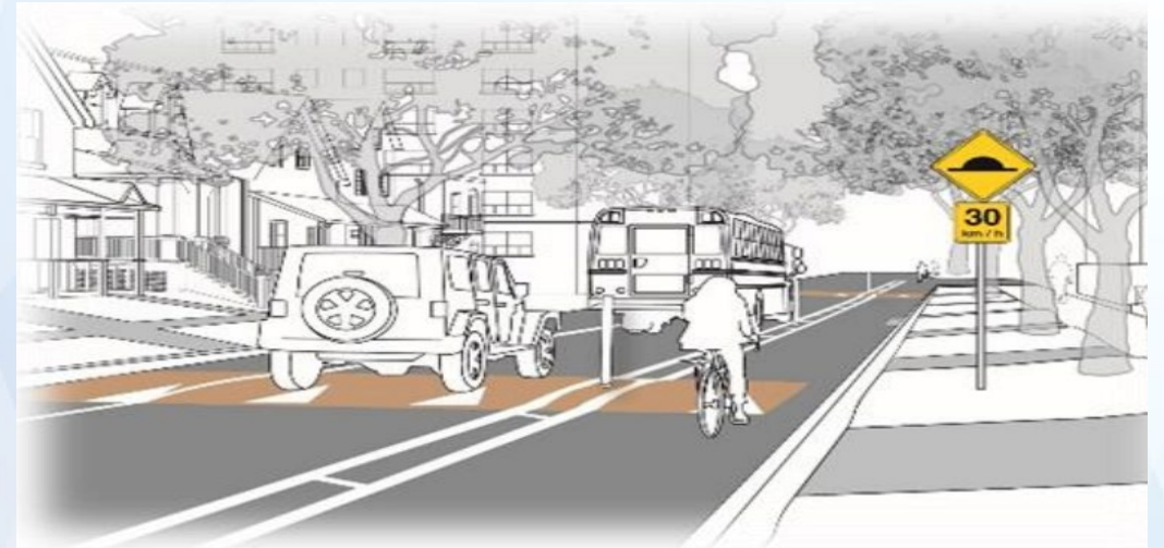
Speed humps / Dos d'âne allongés