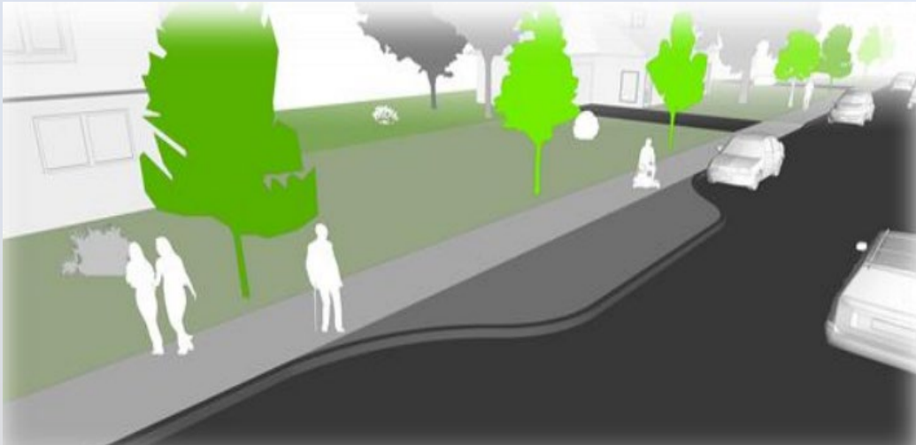
Mid-block narrowings / Avancées de trottoir à mi-pâté