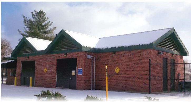
Station de pompage - Carp

Une zone de protection des têtes de puits (ZPTP) est une zone autour d'un puits où des utilisations du sol pourraient nuire à la qualité de l'eau qui s'écoule dans le puits. La superficie et la forme des ZPTP sont établies en fonction de la quantité d'eau pompée, ainsi que de la direction et du débit de l'eau souterraine circulant de l'aquifère au puits.