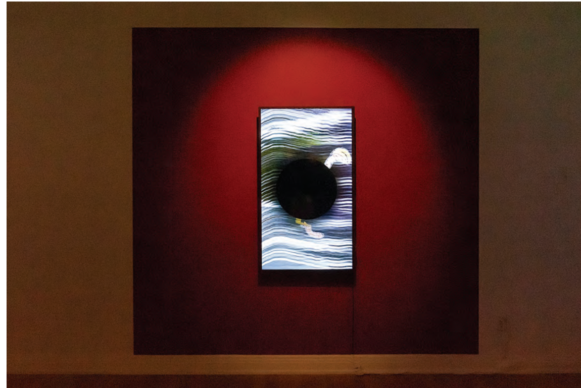
Hugo Gaudet-Dion, Agitation , 2019, vidéo/video

The exhibition title – Agitation – refers directly to the idea of a feverishness that reminds us of the excitement of the molecules in the physical world surrounding and containing us. The atomic universe is made up of an ongoing energetic quivering we can relate, by way of metaphor, to human activity, which sometimes appears to us as a frenetic convulsion bordering on the indistinct boundaries of original chaos. Now, chaos is the very image of violence and the events that refer to it, natural cataclysms, world wars or major economic breakdowns, readily take on this character in the popular imagination. Hugo Gaudet-Dion's drawings and music translate this violence as much through the visual and sonic cacophony as through the evocation of the characters' monstrosity. Within this trepidation, Raymond Aubin recognizes the need to create "various myths (religious, social, philosophical, scientific, and artistic) that help us organize society and to live in everyday life."