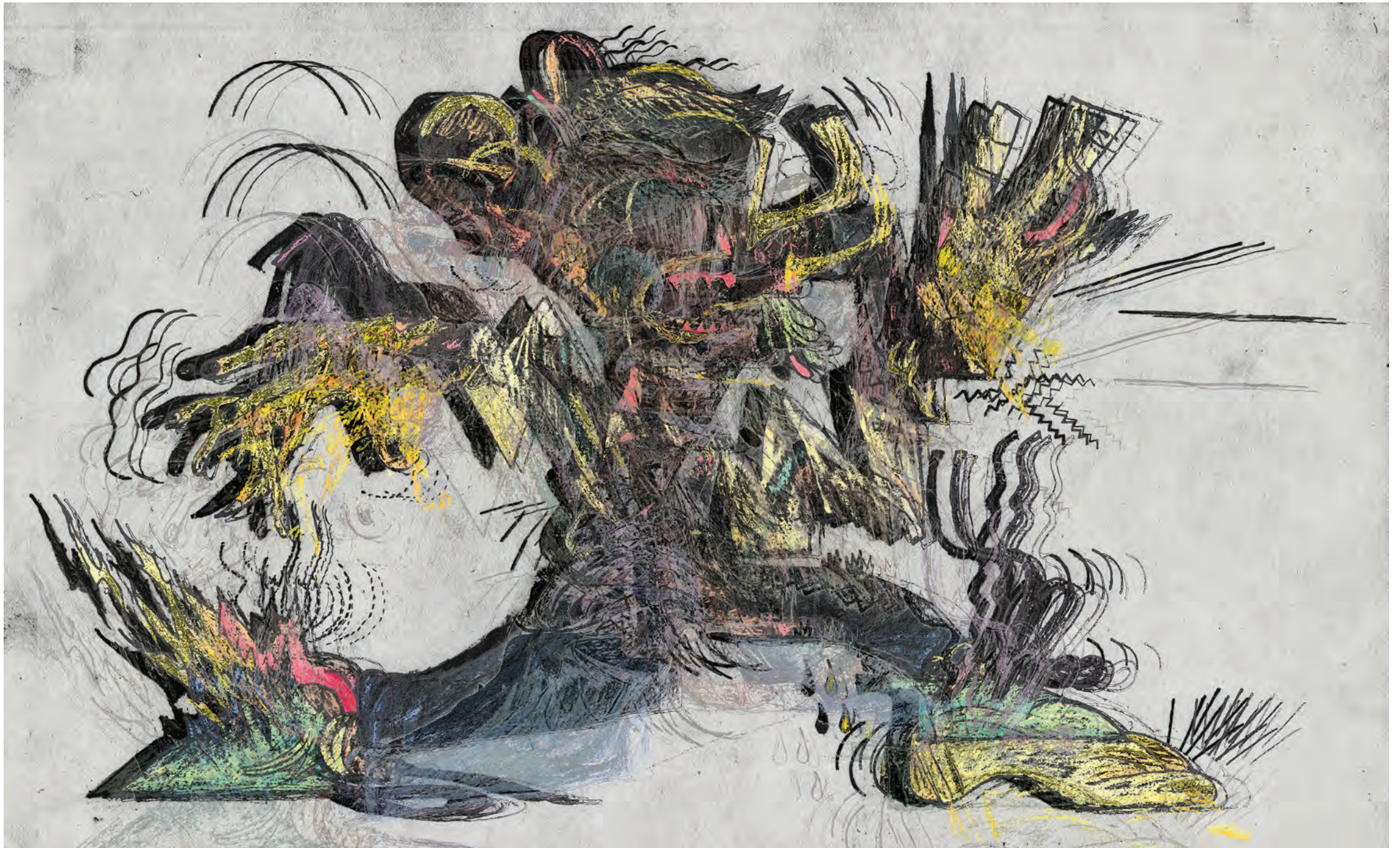
Hugo Gaudet-Dion, Agitation , 2019, jet d'encre sur vinyle autocollant / inkjet on vinyl sticker, 75 x 122 cm