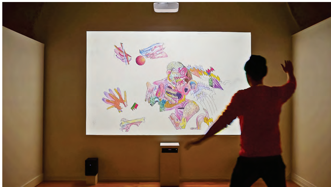
Raymond Aubin et/and Hugo Gaudet-Dion, Agitation , 2019, dispositif vidéo interactif : projecteur, capteur Kinect, ordinateur, interface audio, hautparleurs / interactive video device: projector, Kinect sensor, computer, audio interface, speakers