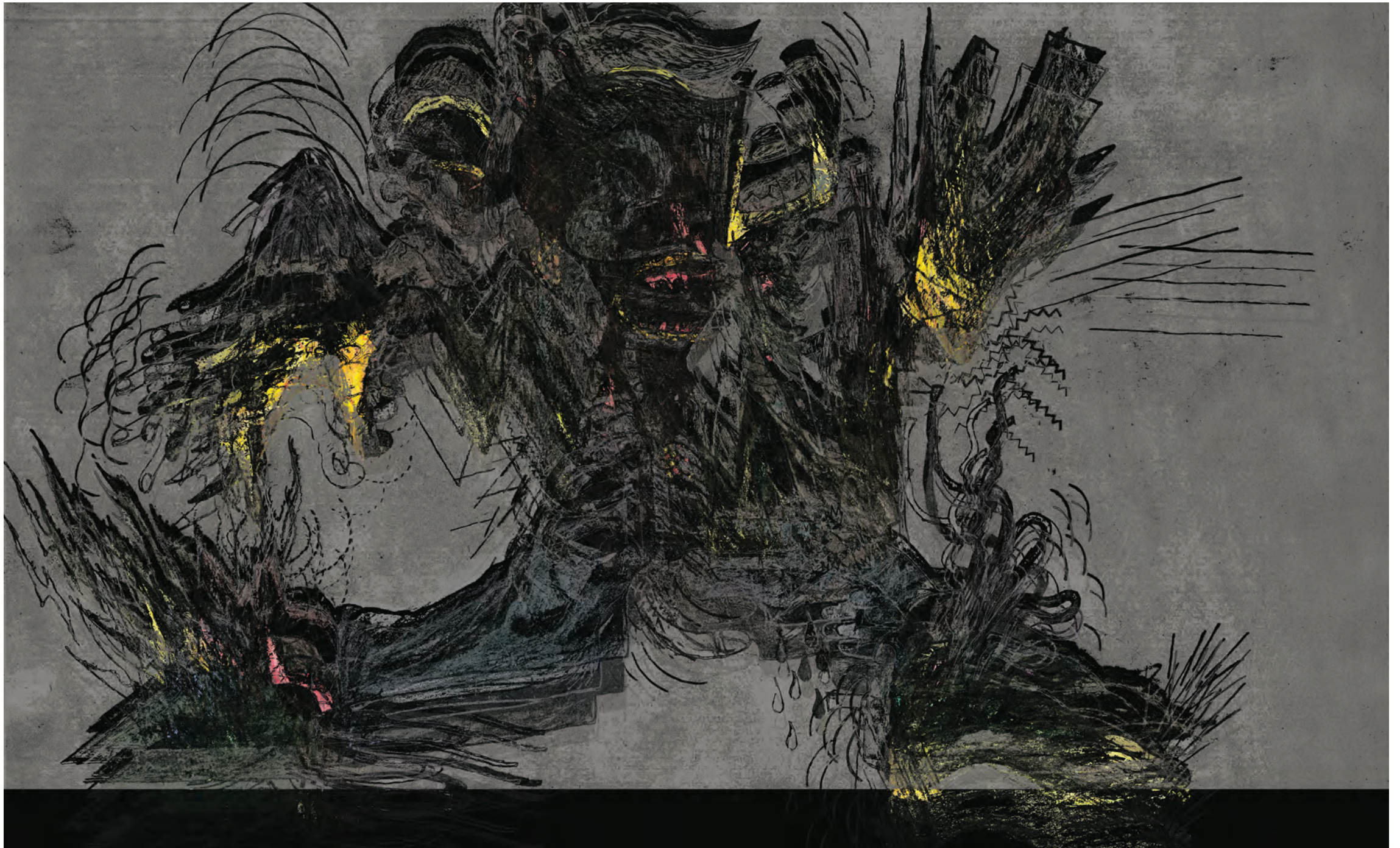
Hugo Gaudet-Dion, Agitation , 2019, jet d'encre sur vinyle autocollant / inkjet on vinyl sticker, 75 x 122 cm