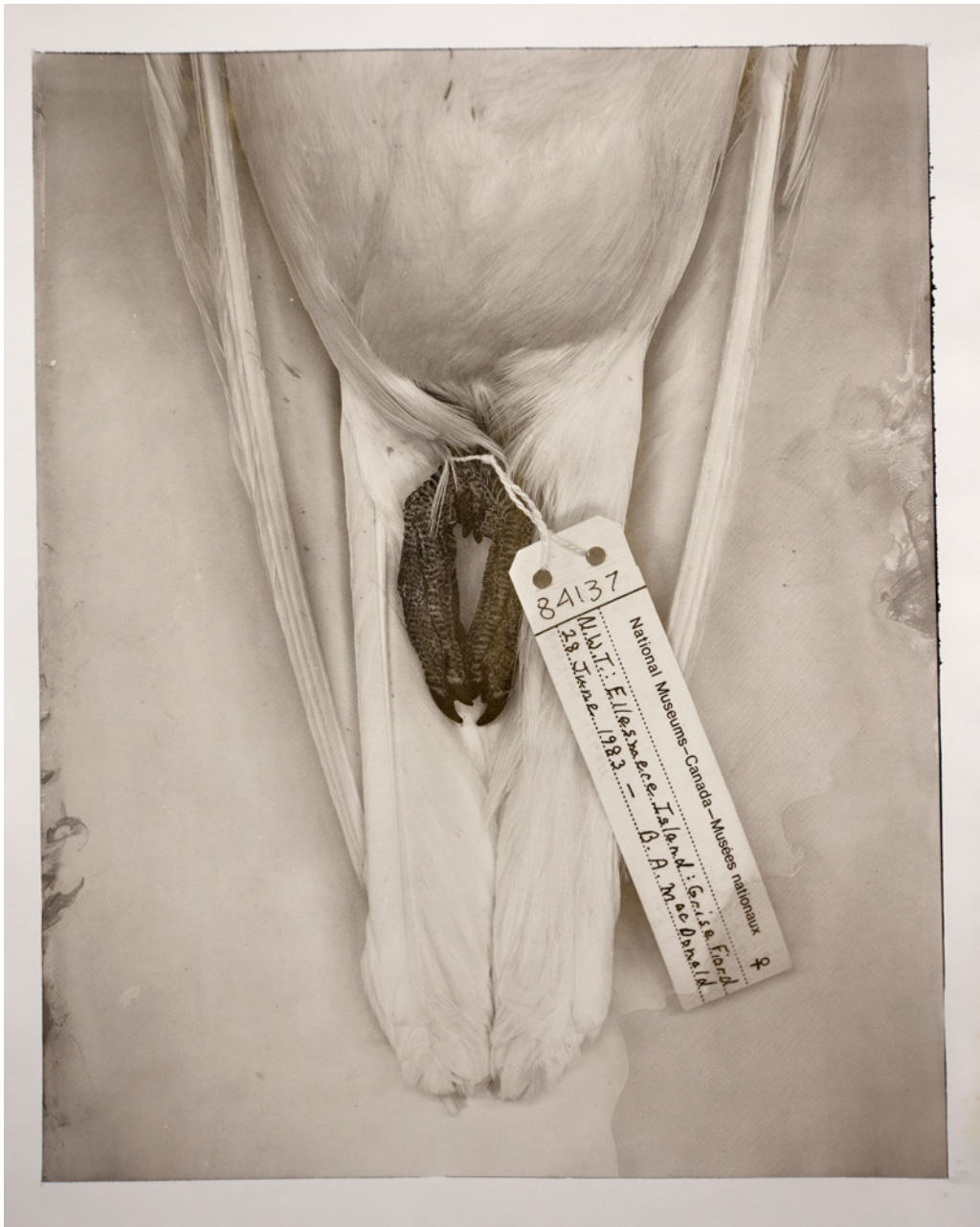
Ivory Gull , 2023, pigmented gum impressions on palladium on archival rag / impressions pigmentaires à la gomme sur papier chiffon d'archive par tirage au palladium, 72 x 84 cm (framed / œuvre encadrée), Canadian Museum of Nature Collection / Collection du Musée canadien de la nature