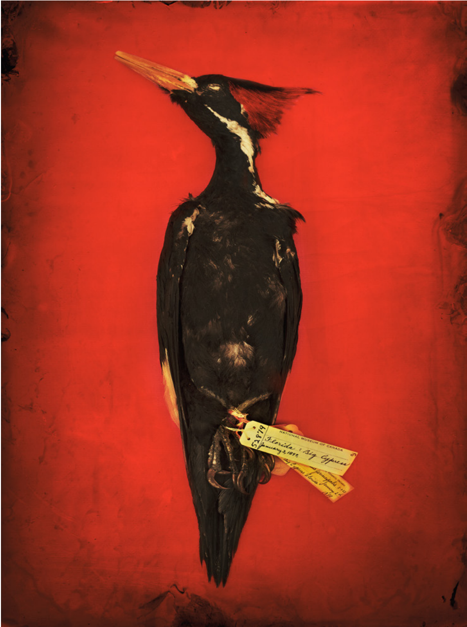
Ivory-billed Woodpecker, 2023, pigment print on archival rag / impression pigmentaire sur papier chiffon d'archive, 114 x 86 cm (framed / œuvre encadrée), Canadian Museum of Nature Collection / Collection du Musée canadien de la nature Presumed Extinct / Espèce présumée disparue