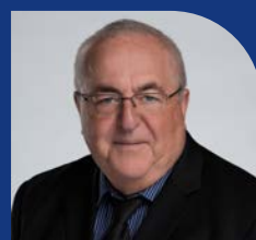
Allan Hublely Quartier 23 Kanata South