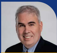
Riley Brockington Quartier 16 River