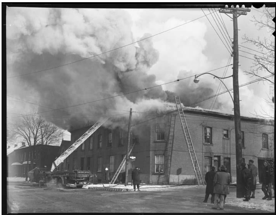
Figure 6 : Incendie dans un immeuble d'habitation au coin des rues Hill et Wellington, 1955