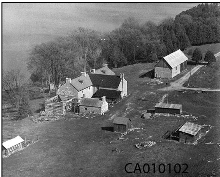
Figure 8 : Vue aérienne de Pinhey's Point à Horaceville, vers 1970 CA010102