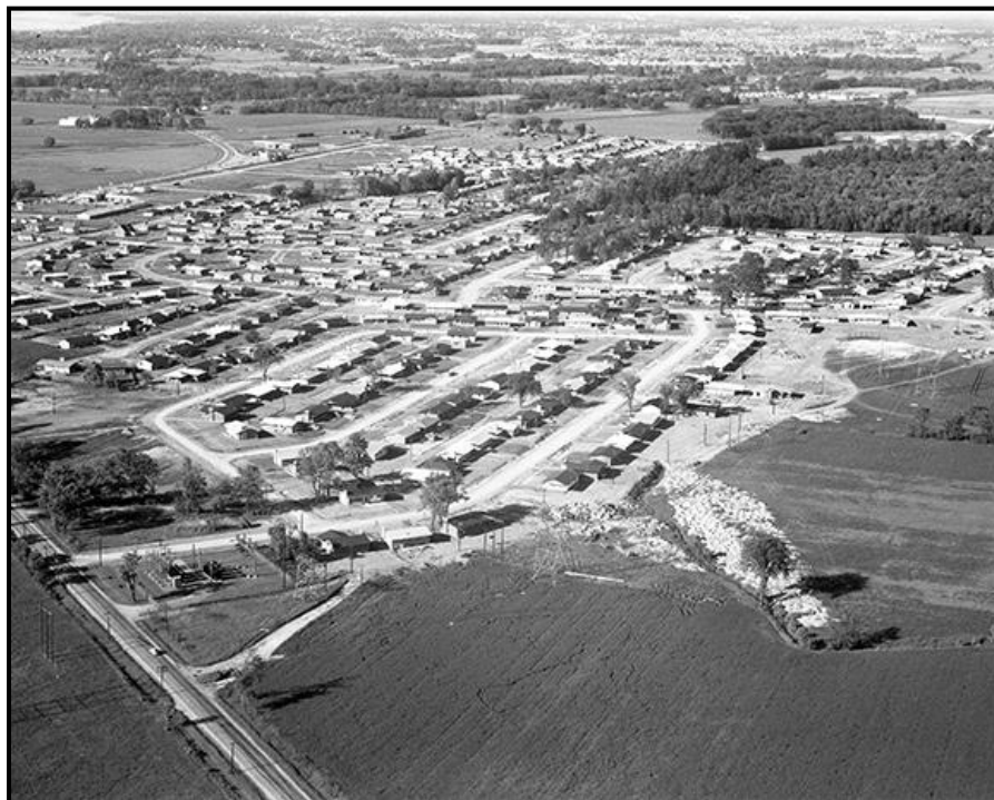
Figure 1 : Vue aérienne de Lynwood Village, 1961 | Archives de la Ville d'Ottawa, CA008476