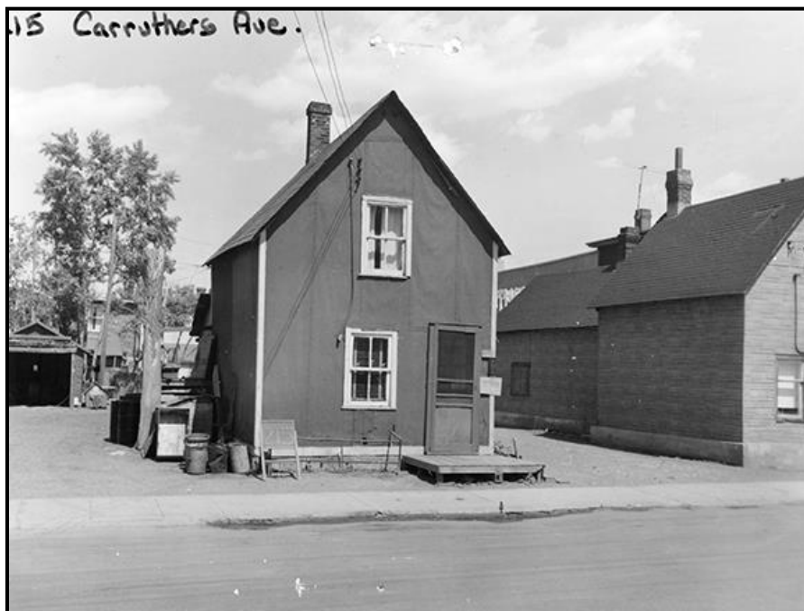
Figure 7 : 215, avenue Carruthers | Archives de la Ville d'Ottawa, CA024791