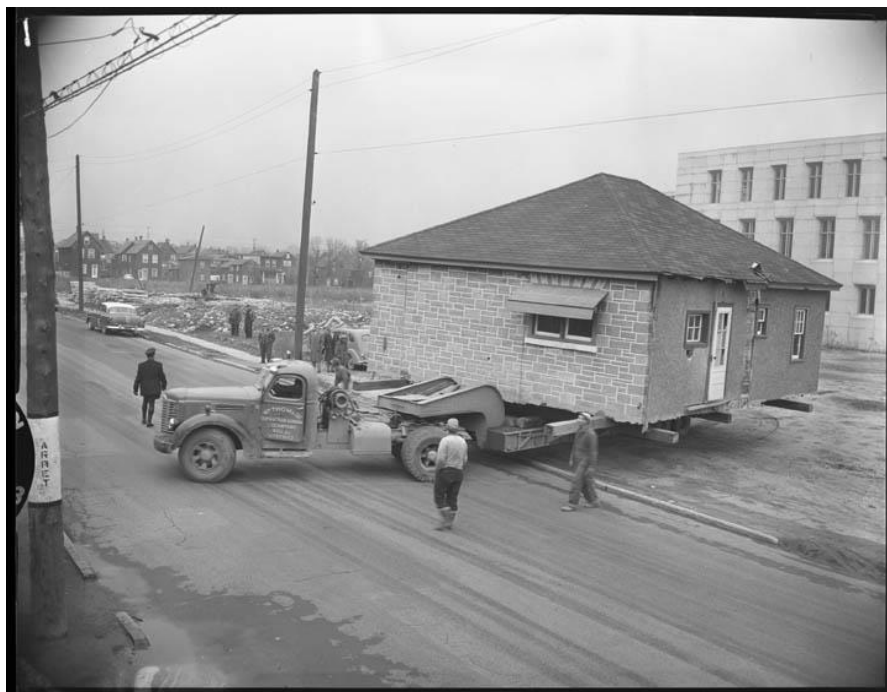
Figure 5 : Déplacement d'une maison, 1955

plan montre aussi le nombre d'étages et l'adresse municipale, qui pourraient avoir changé au fil du temps.