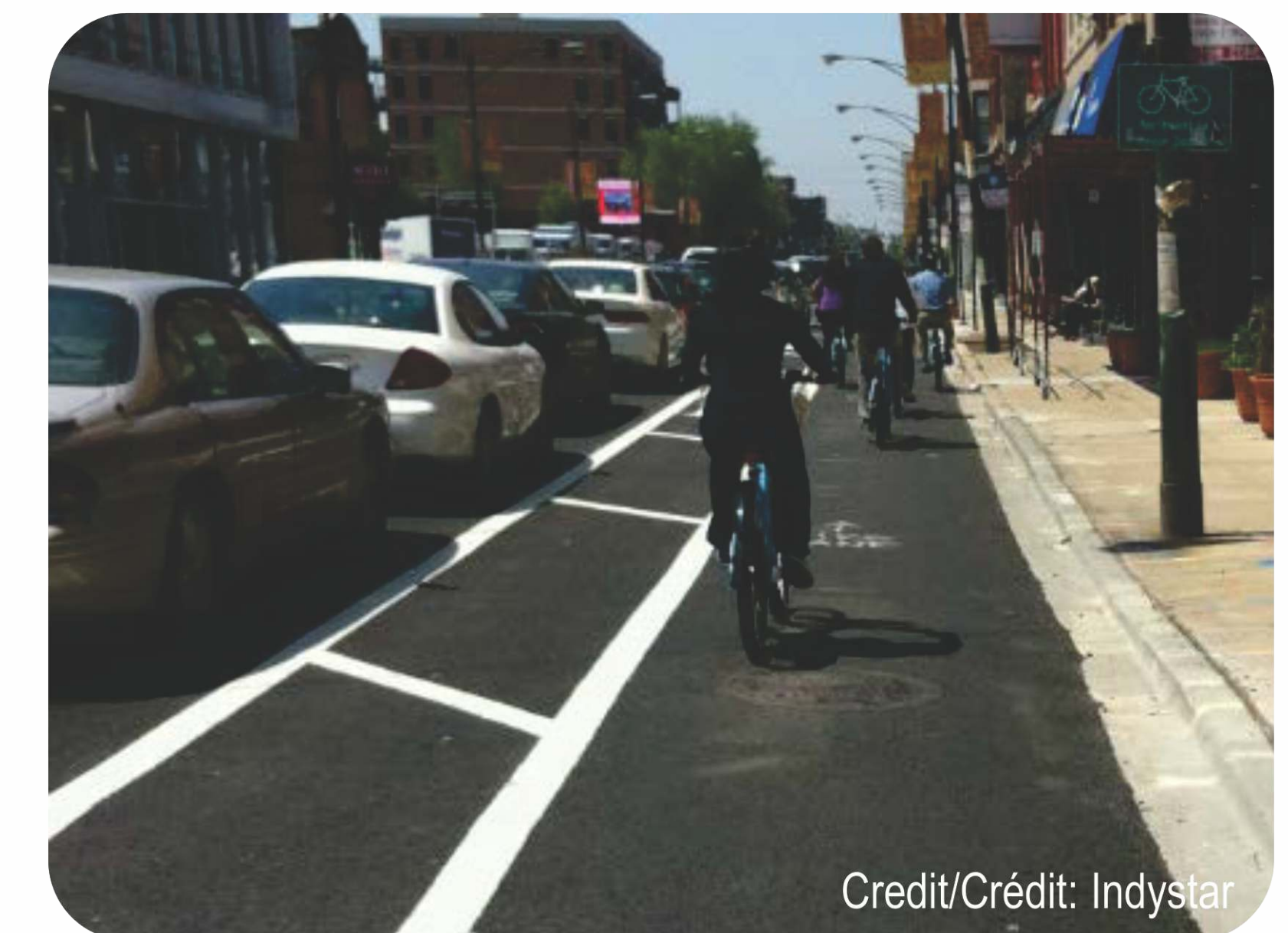
St. Louis, MO