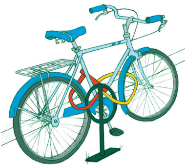
Illustration: Thomas James

Pour planifier un itinéraire qui prévoit des déplacements à bord d'autobus munis d'un support à vélo ou de l'O-Train seulement, choisissez l'option Vélo-bus dans le Planificateur de trajet en ligne d'OC Transpo.