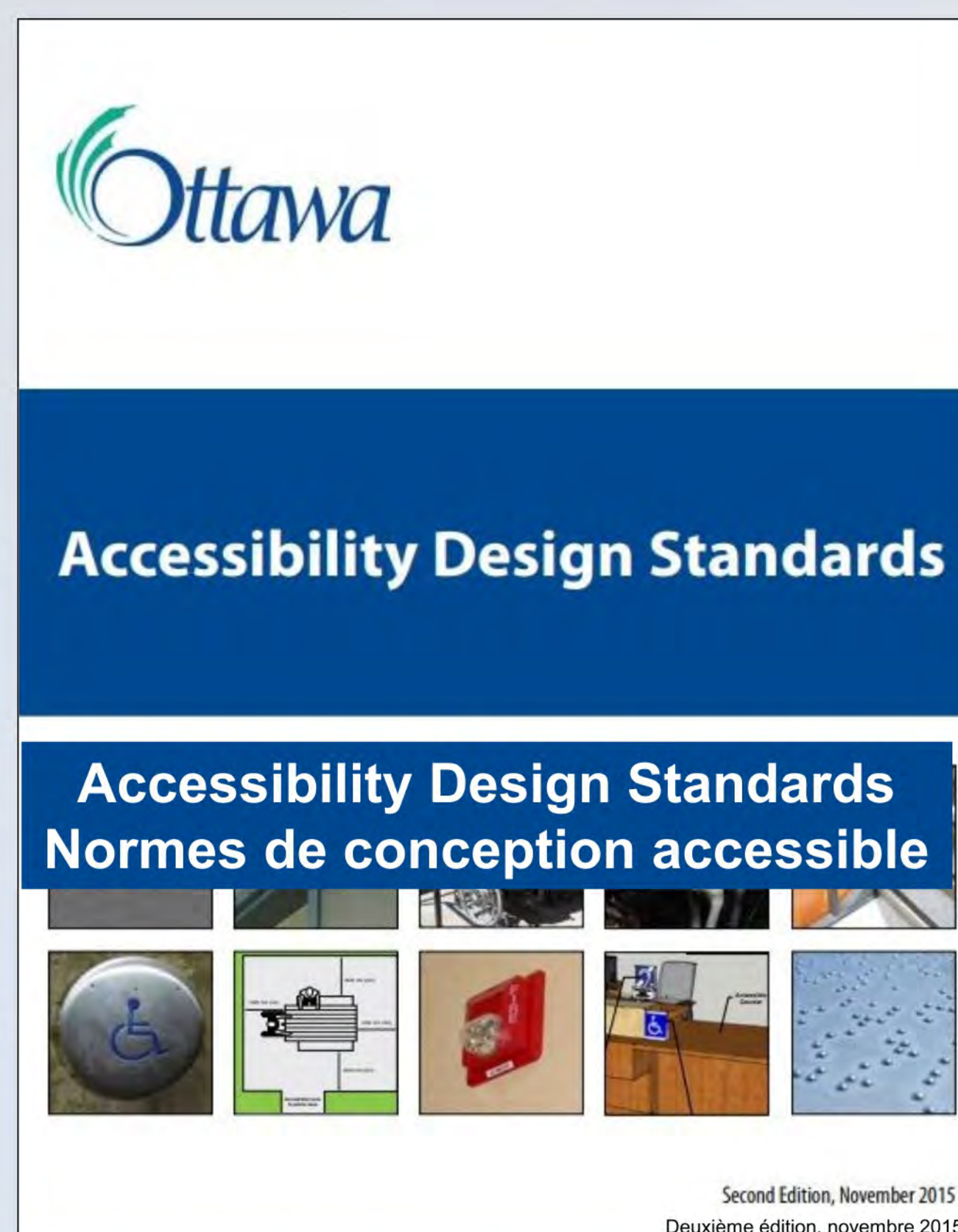
Tactile Walking Surface Indicator Indicateur tactile de surface de marche