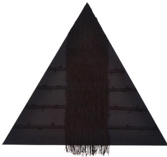
Claudia Gutierrez, RAPACEJO , 2021, acrylic and wool hand embroidered on cotton / laine et acrylique brodés à la main sur du coton, 102 x 102 cm

Dans les œuvres de Claudia Gutierrez, tension, raideur et texture se mêlent tant littéralement que métaphoriquement. Née au Canada de parents d'origine mexicaine et uruguayenne, elle vit à Ottawa depuis 2008. Sa démarche a évolué de la peinture et de la gravure à la fabrication de textile. Elle s'inspire des motifs qu'elle trouve dans le langage écrit, du toucher de ses matériaux et du potentiel du travail manuel, à la fois répétitif et méditatif, pour tisser ensemble les notions de lignée, de lieu et de liminalité. Claudia Gutierrez exploite souvent plusieurs contrastes formels, l'ombre et la lumière, la douceur et la rigidité, la lourdeur et la flottabilité, pour évoquer la contraction et la contradiction dans son œuvre. Faisant écho à la tradition de la peinture monochrome, les œuvres de l'artiste présentées ici ouvrent des voies vers le hasard, la connexion et la communion. Elles juxtaposent des rapacejos (franges) mexicaines, à la fois fluides et très élaborées, et la rigidité austère de toiles pyramidales. Mises à nu dans la physicalité de leur construction, les œuvres font converger des connaissances protéiformes et relient des moments éloignés dans le temps, tout en détournant, défiant et dénouant nos attentes perceptuelles conventionnelles.