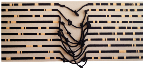
Claudia Gutierrez, Tapame Con Tu Rebozo , 2021, acrylic and wool hand embroidered on linen / laine et acrylique brodés à la main sur du lin, 76 x 183 cm

Tension, tautness and texture are tied literally and metaphorically into the work of Claudia Gutierrez. Born in Canada to Mexican and Uruguayan parents, she has been based in Ottawa since 2008. Having expanded her practice from painting and printmaking to include textile production, she is inspired by the patterns found in written language, by the tactility of her materials and by the potential for repetitive, meditative handwork to weave together notions of lineage, location and liminality. Gutierrez often exploits severe formal contrasts—light and dark, softness and hardness, weightiness and buoyancy—to evoke contraction and contradiction in her work. Referencing the tradition of monochrome painting, the pieces the artist presents here serve as conduits for chance, connection and communion. They juxtapose intricate, flowing Mexican rapacejos (fringes) with the stark sturdiness of pyramidal canvases. With the physicality of their construction laid bare, the works knot together multiple forms of knowledge and tether disparate moments in time, all the while shifting, defying and unravelling our conventional perceptual expectations.