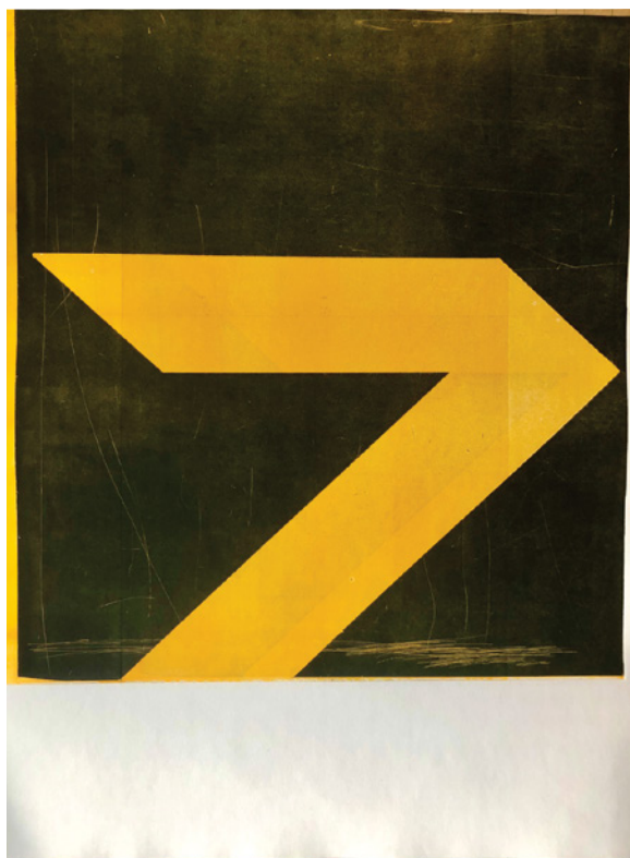
Guillermo Trejo, Yellow seven (detail/détail) [from the series / de la série West Coast ], 2019, relief monoprint on archival Stonehenge paper / monotype en relief sur papier Stonehenge pour archives, 56 x 76 cm

A consummate printer, drawer and bricoleur, Guillermo Trejo consistently engages with the tropes of high modernism to question its utopian reliance on utility, formalism and geometry. Born in Mexico City, he moved to Ottawa in 2007. Trejo's practice has been informed as much by the physical experience of immigration as by the conceptual notions of distance, acclimatization and disorientation. His work adeptly juxtaposes politics and protest with theories of design and aesthetics. He repositions iconic images, symbols and fixtures to propose new—and at times provisional—ways of understanding specific moments in his personal history. This exhibition presents works where Trejo has pressed, folded and carved rudimentary materials like cardboard, raw wood and Manila paper into alternative, newly functional objects. Inspired by notions of self-sufficiency, the artist creases and collapses the idiom of “form follows function” to demonstrate the fallacy of its Eurocentric lineage.