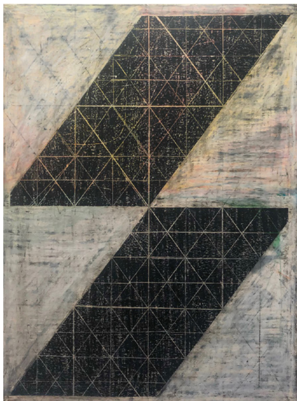
Guillermo Trejo, Parallelograms on Black (detail/détail) [from the series / de la série Exercises with a Set Square ], 2021, wax crayons on wooden panel / pastels à la cire sur panneau de bois, 56 x 76 cm

Peintre, dessinateur et bricoleur émérite, Guillermo Trejo engage un dialogue incessant avec les tropes du haut-modernisme pour remettre en question sa dépendance utopiste à l'utilité, au formalisme et à la géométrie. Né à Mexico, il a déménagé à Ottawa en 2007. La démarche artistique de Guillermo Trejo est influencée tant par son expérience physique de l'immigration que par les notions conceptuelles de la distance, de l'acclimatation et de la désorientation. Son travail juxtapose la politique et la contestation, et les théories de la création et de l'esthétique. Il repositionne des images emblématiques, des symboles et des installations pour proposer de nouvelles façons, parfois provisoires, de comprendre certains moments de son histoire personnelle. Cette exposition présente des œuvres dans lesquelles Guillermo Trejo a pressé, plié et sculpté des matériaux rudimentaires comme du carton, du bois brut et du papier de Manille pour créer des objets de substitution doués d'une nouvelle fonctionnalité. Inspiré par les notions d'autosuffisance, l'artiste fait et défait l'expression « la forme suit la fonction » pour démontrer l'illusion de sa lignée eurocentrique.