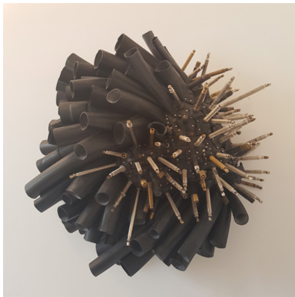
Marisa Gallemmit, Marina , 2017, wooden mask, bicycle tubes, tube valves, nails / masque de bois, chambres à air pour vélo, valves de chambres à air et clous, 25 x 23 x 10 cm

Née à Ottawa et ayant grandi dans cette ville, Marisa Gallemmit a recours à tout un éventail d'outils et de techniques pour excaver, incarner et explorer les liens matrilinéaires qu'elle entretient avec ses racines philippines. Pour elle, la création artistique est un acte d'accès à la connaissance et de connexion intergénérationnelle. Marisa Gallemmit transforme des matériaux de récupération comme des touches de piano, des chambres à air de bicyclette et des tapis de pandanus en objets porteurs d'une résonance familiale, voire psychique. Ses sculptures lui permettent d'expérimenter une dimension spatiotemporelle qui n'est pas la sienne, de l'éprouver physiquement, et de l'ancrer dans sa mémoire musculaire. Dans cette exposition, les œuvres de Marisa Gallemmit revisitent le malong, un vêtement tubulaire du sud des Philippines, réputé pour sa grande polyvalence et son exceptionnelle adaptabilité. Cousant, tissant et fabricant le vêtement à l'aide de matériaux inattendus, voire disparates, l'artiste le restructure en lui donnant d'autres formes fantastiques et en transposant sa mutabilité dans son propre langage visuel.