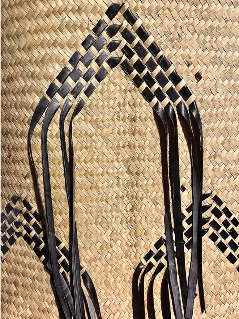
Marisa Gallemit, Benevolent Assimilation (detail/détail), 2021, pandanus leaf, rubber tubes / feuilles de pandanus et bandes de caoutchouc, 164 x 92 x 54 cm