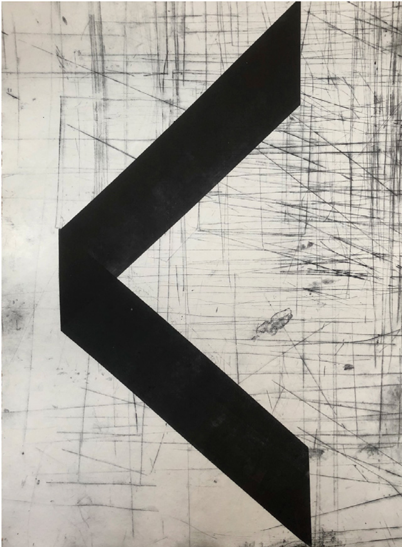
Guillermo Trejo, Black arrow (detail/détail) [from the series / de la série West Coast ], 2019, relief monotype on archival Stonehenge paper / monotype en relief sur papier Stonehenge pour archives, 76 x 56 cm