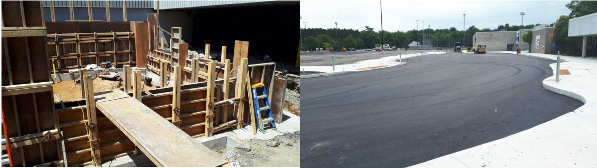
Photo à gauche : Asphaltage du parc de stationnement est près des entrées 2, 3 et 4 du Sportsplex de Nepean