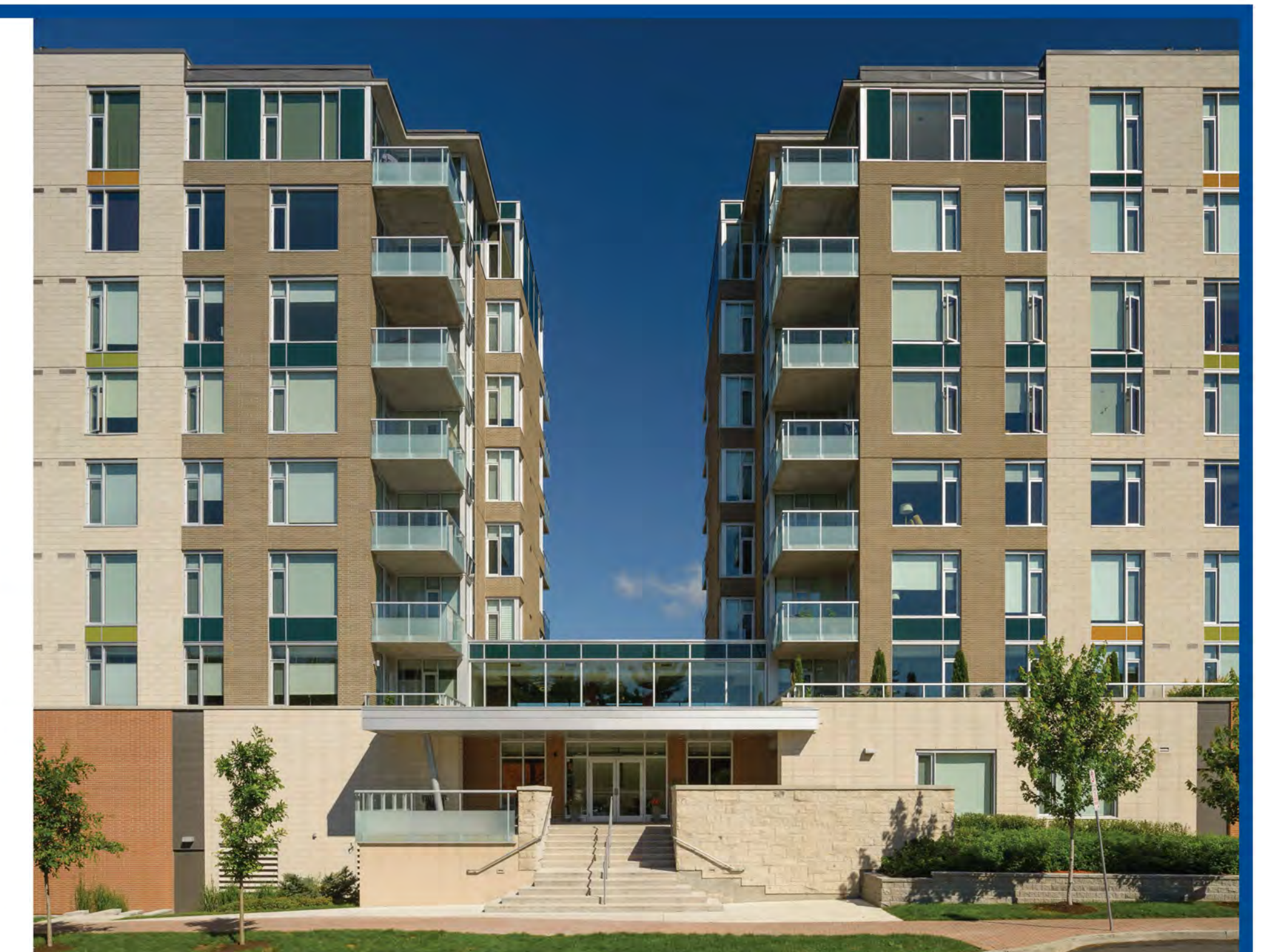
The same building from Byron Avenue Le même immeuble sur l'avenue Byron.