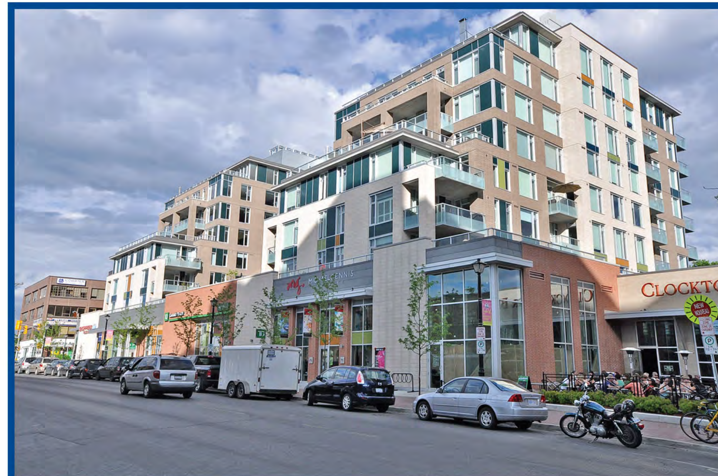
An angular plane on Richmond Road. Plan de hauteur angulaire sur le chemin Richmond.

5. La hauteur des nouveaux immeubles devrait diminuer à partir du chemin Richmond vers les secteurs de faible hauteur.