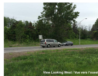
View Looking West / Vue vers l'ouest