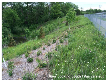
View Looking South / Vue vers sud