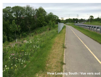
View Looking South / Vue vers sud