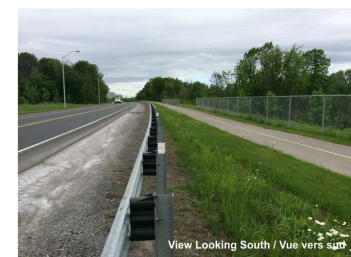
View Looking South / Vue vers sud