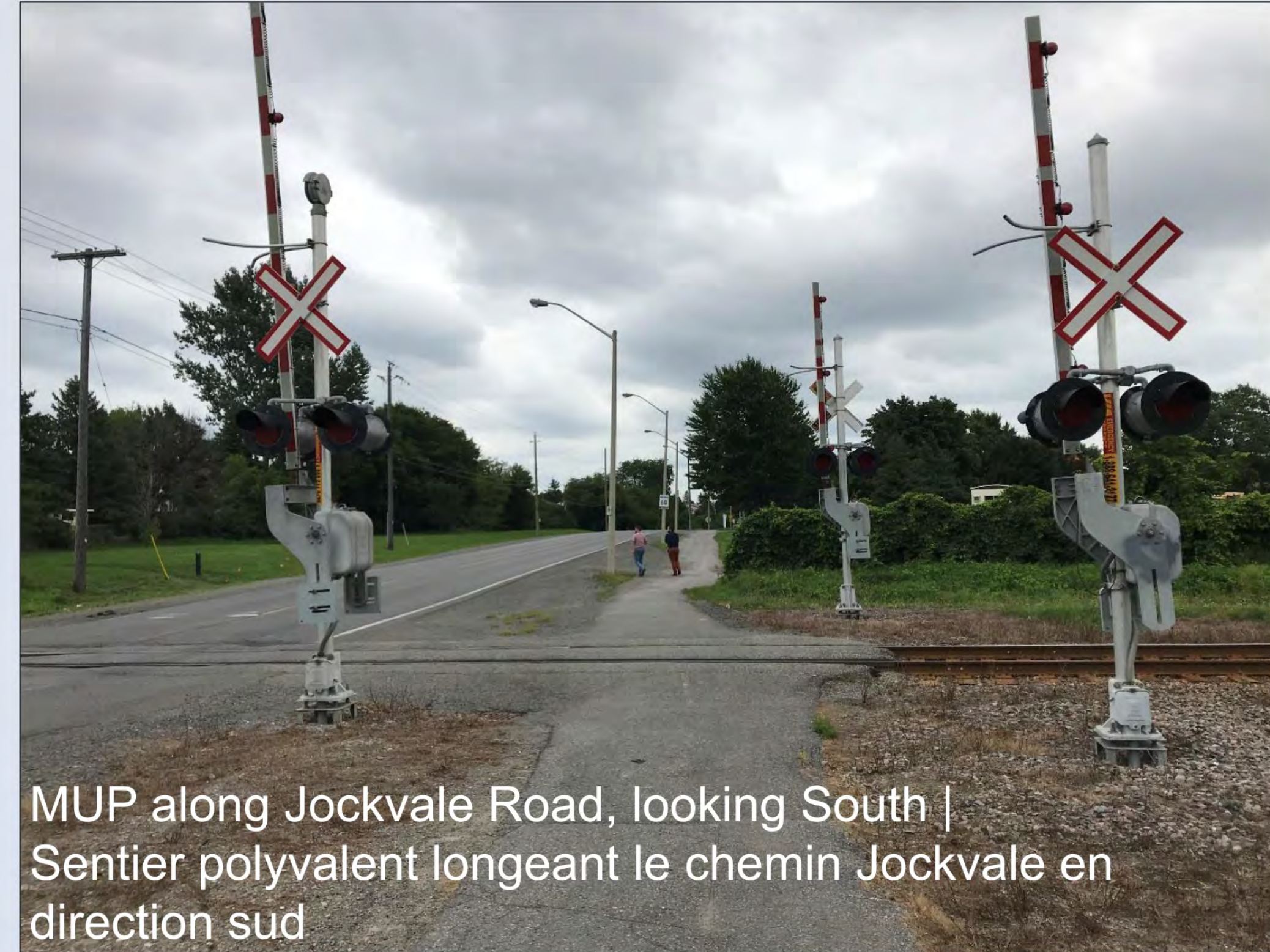
MUP along Jockvale Road, looking South | Sentier polyvalent longeant le chemin Jockvale en direction sud