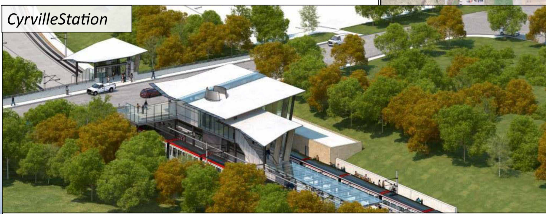
Station design is consistent with design vision along Confederation Line / Conception des stations conforme à la vision pour la Ligne de la Confédération