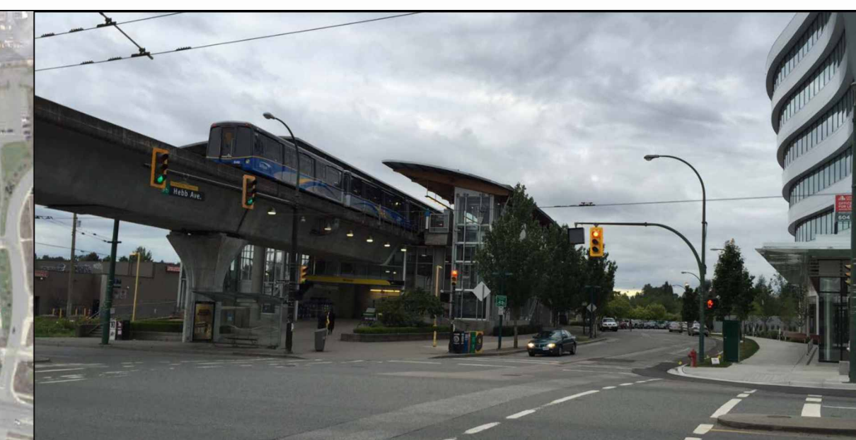
Examples of Elevated Guideway. Visible, and provides for flow of vehicles and traffic underneath / Voie de guidage surélevée. Bonne visibilité, et permet aux véhicules de circuler en dessous