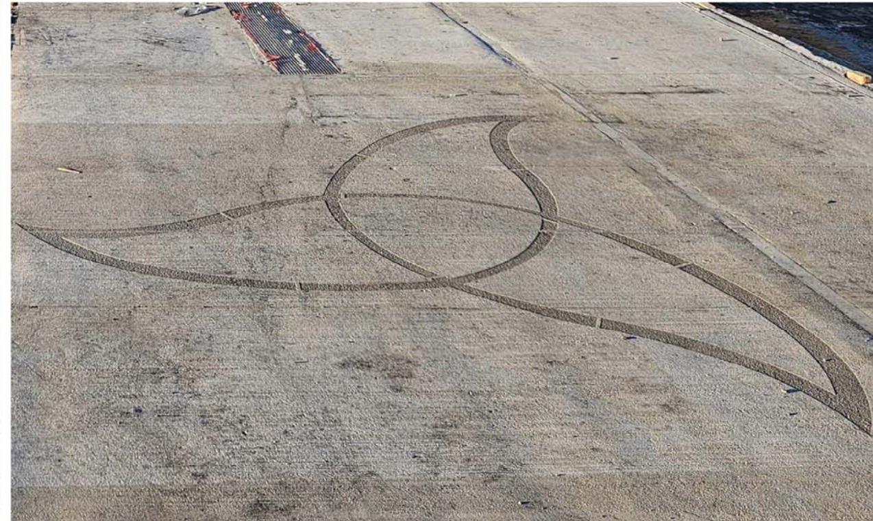
SANDBLASTED CONCRETE / BÉTON SABLÉ