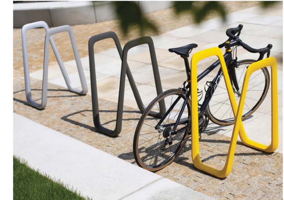
BIKE RACKS / SUPPORTS À BICYCLETTES