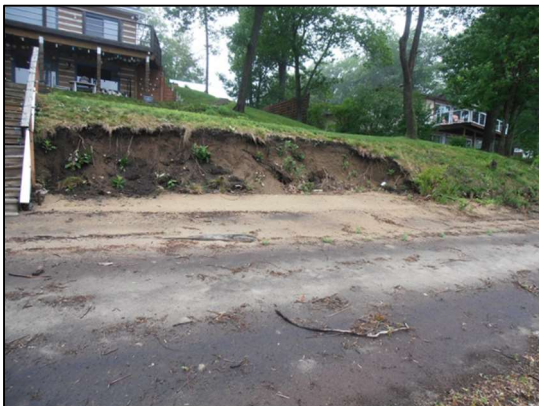
Figure 1. Lutte contre l'érosion des berges de Constance Bay dans la foulée des inondations de 2017