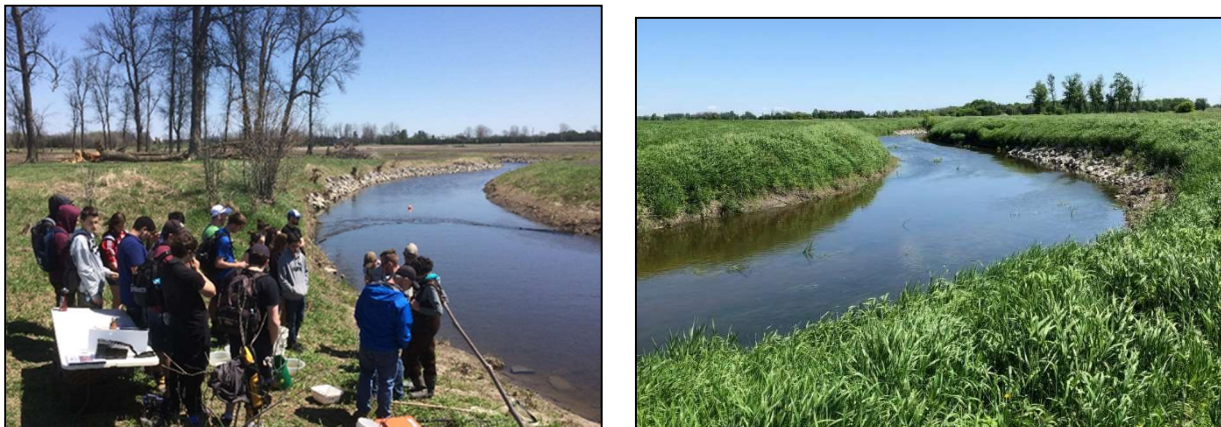
Figure 4 – Site de démonstration des zones tampons herbacées le long du drain municipal Castor Sud

Malgré ces efforts permanents de promotion et de sensibilisation, la plupart des répondants au sondage (80 %) étaient d'avis que la promotion du PAEMRO n'est pas efficace. D'anciens participants ont fait savoir en grand nombre qu'ils ne connaissaient pas du tout le Programme avant qu'un entrepreneur, un voisin ou un membre du personnel d'un office de protection de la nature leur en parle. Ce commentaire est étayé par le fait que les recommandations des entrepreneurs et des organismes et le bouche-à-oreille continuent de représenter les sources les plus répandues de nouveaux demandeurs (cf. l'annexe 6).