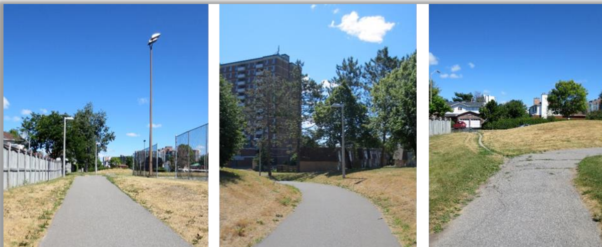
Sentier reliant Foster Farm à l'avenue Grenon (traversant le parc Ruth-Wildgen)