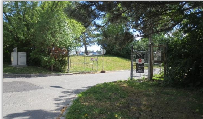
Entrée du garage Pinecrest sur l'avenue Connaught