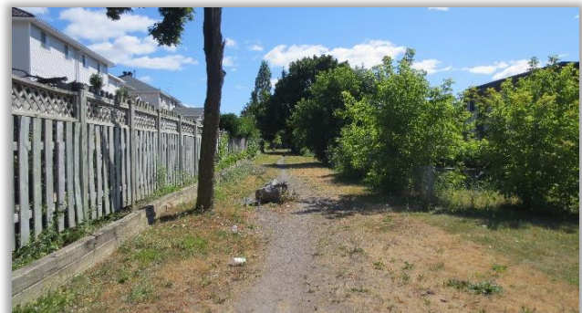
Sentier reliant l'avenue Dumaurier au parc Ruth Wildgen (passant par Foster Farm)