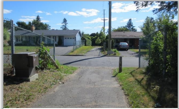
Sentier traversant la promenade Southwood et reliant l'avenue Sudbury au chemin Stanton