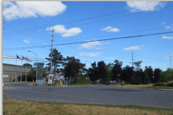
Impasse de la promenade Queensview