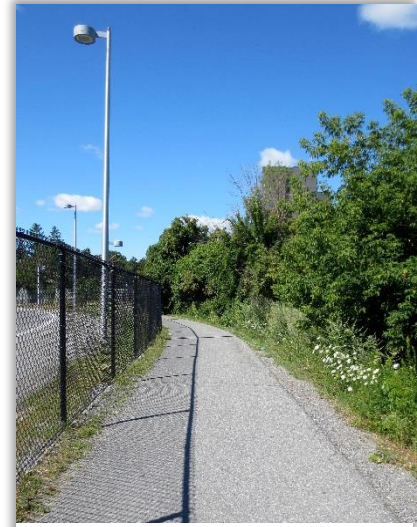
Allée piétonnière depuis la station Pinecrest jusqu'à Foster Farm