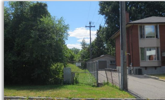
Extrémité nord du garage d'autobus