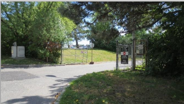
Extrémité sud du garage d'autobus