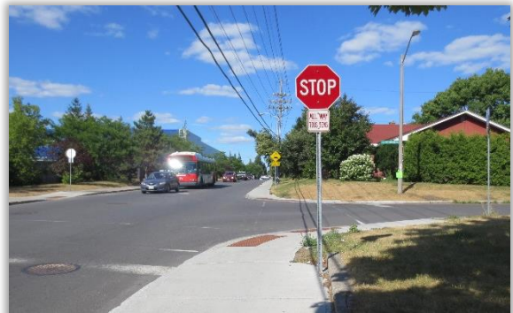
Intersection de la rue Iris et de la promenade Southwood