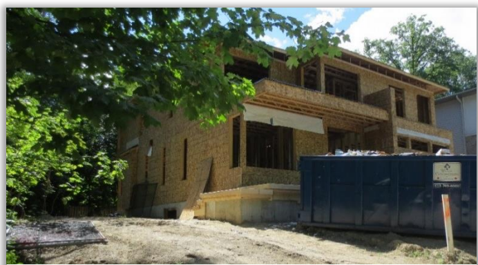
Construction sur la Terrasse Queensway-Nord