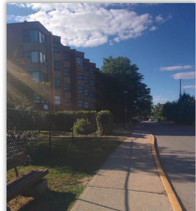
West End Villa