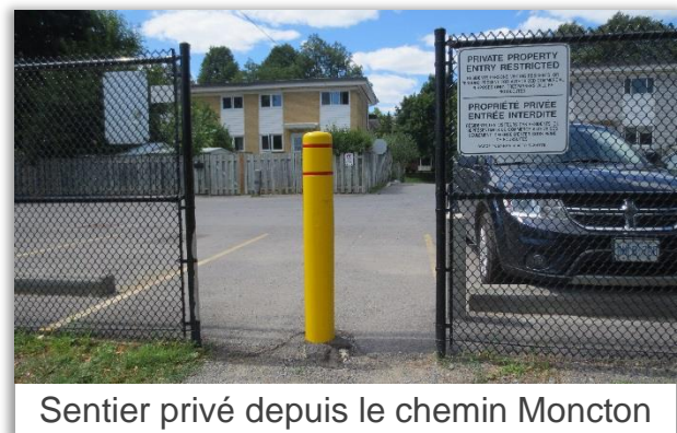
Sentier privé depuis le chemin Moncton