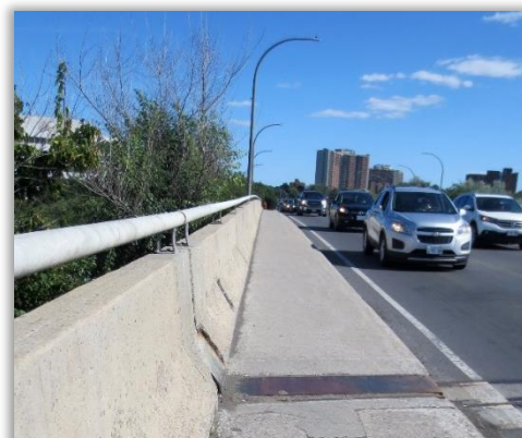
Trottoirs du pont Pinecrest