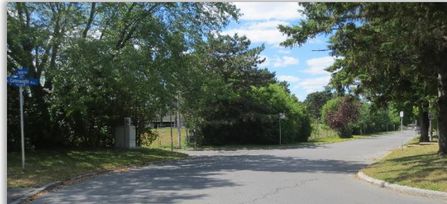
Intersection des avenues Roman et Connaught