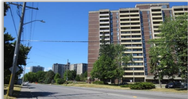
Logements sur le chemin Richmond