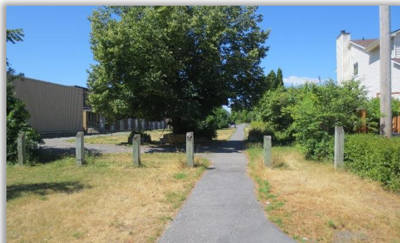
Sentier reliant la rue Farrell et l'avenue Grenon