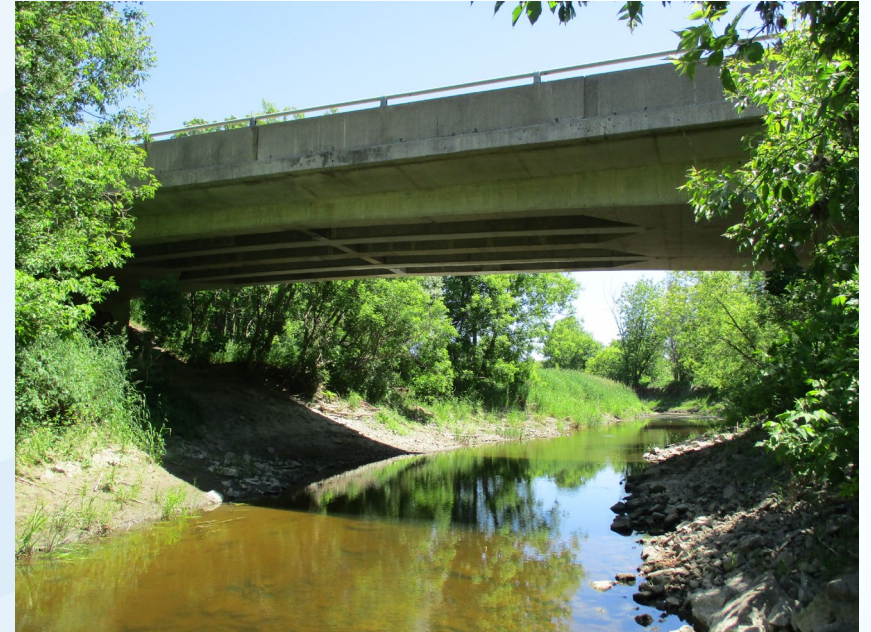
Pont Quesnel – Élévation nord