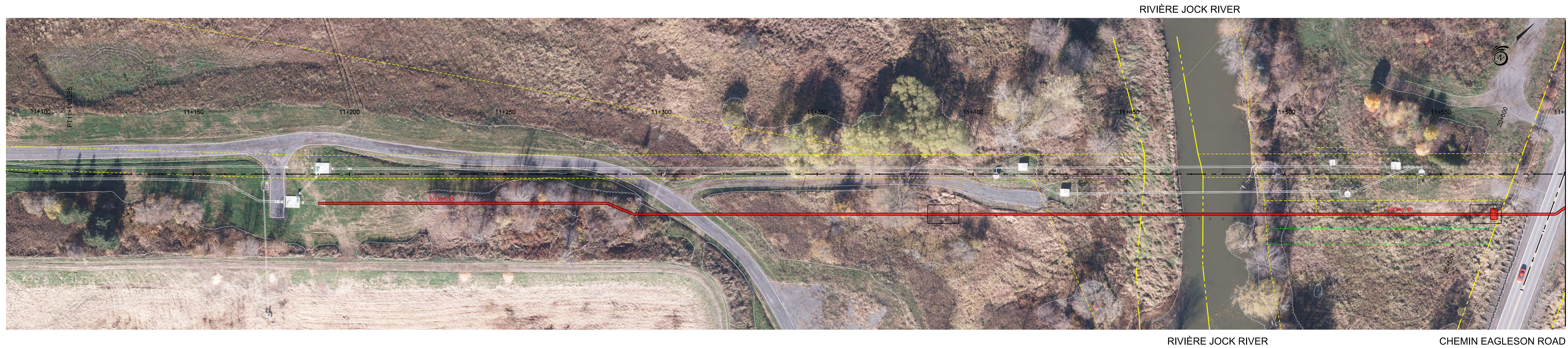
RIVIÈRE JOCK RIVER RIVIÈRE JOCK RIVER CHEMIN EAGLESON ROAD