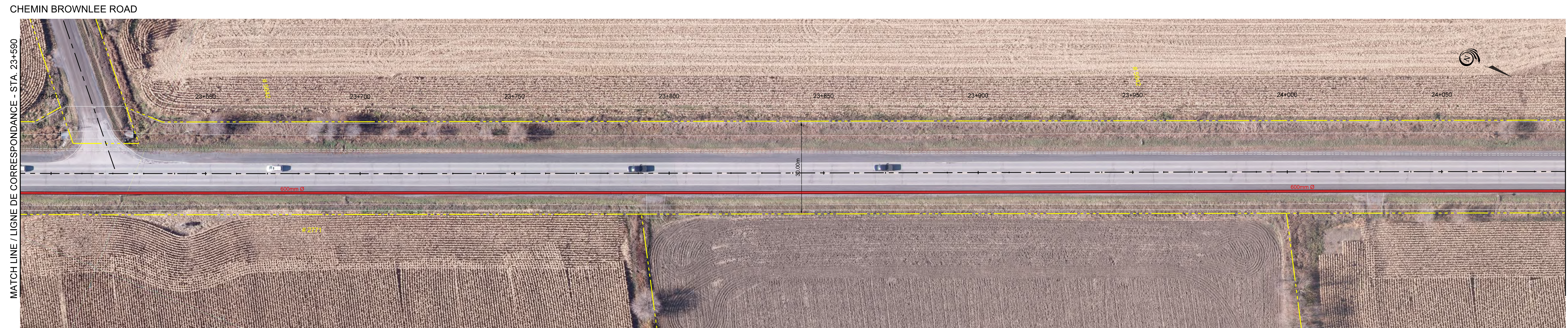
CHEMIN EAGLESON ROAD