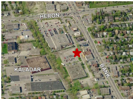
Emplacement possible d'un parc de stationnement municipal sur l'avenue Wildwood

Dans le cadre de la stratégie de gestion du stationnement, un parc de stationnement municipal est proposé sur l'avenue Wildwood. Ce parc offrirait des places de stationnement aux commerces des environs, en particulier ceux situés près du chemin Heron et de la rue Bank, et ceux entre le chemin Heron et la promenade Alta Vista. La Ville devrait permettre les règlements financiers des exigences de stationnement lors du réaménagement des petits terrains qui risquent de satisfaire difficilement aux exigences de stationnement.