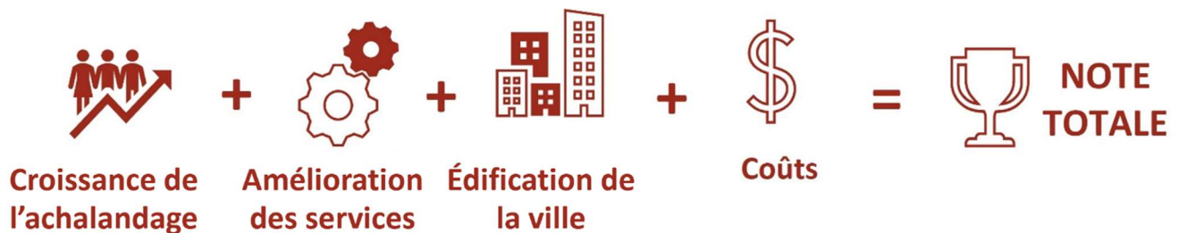
Pièce 2 : Structure-cadre de priorisation des projets de transports en commun

La structure-cadre proposée pour la priorisation des projets de transports en commun prévoit des critères et des indicateurs inspirés des objectifs du Plan officiel, des politiques du PDT, des structures-cadres du PDT de 2013 ainsi que des résultats de la consultation publique. La pièce 2 fait la synthèse de ces critères.