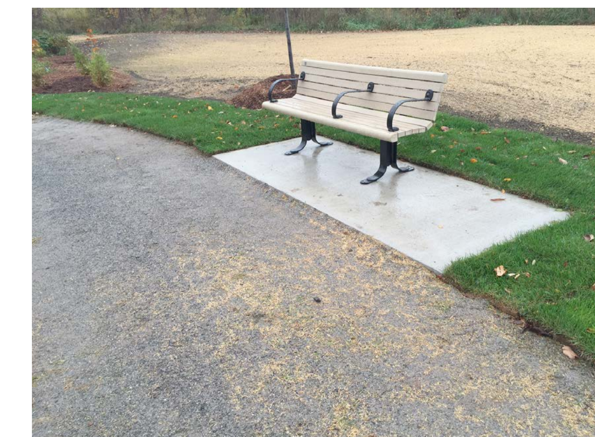
ACCESSIBLE BENCH AND PAD Banc et plateforme accessibles