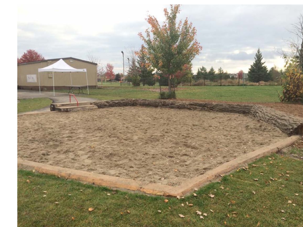
SAND PLAY AREA WITH LOG EDGE Carré de sable avec soutènement en rondins