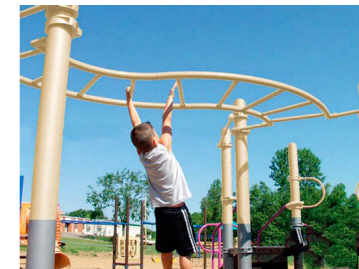
OVERHEADED LADDER Échelle horizontale