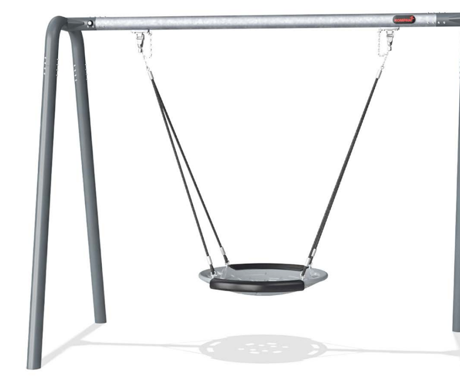
ACCESSIBLE SAUCER SWING Balançoire-soucoupe accessible