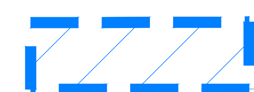
Limits of Construction / Limites du chantier