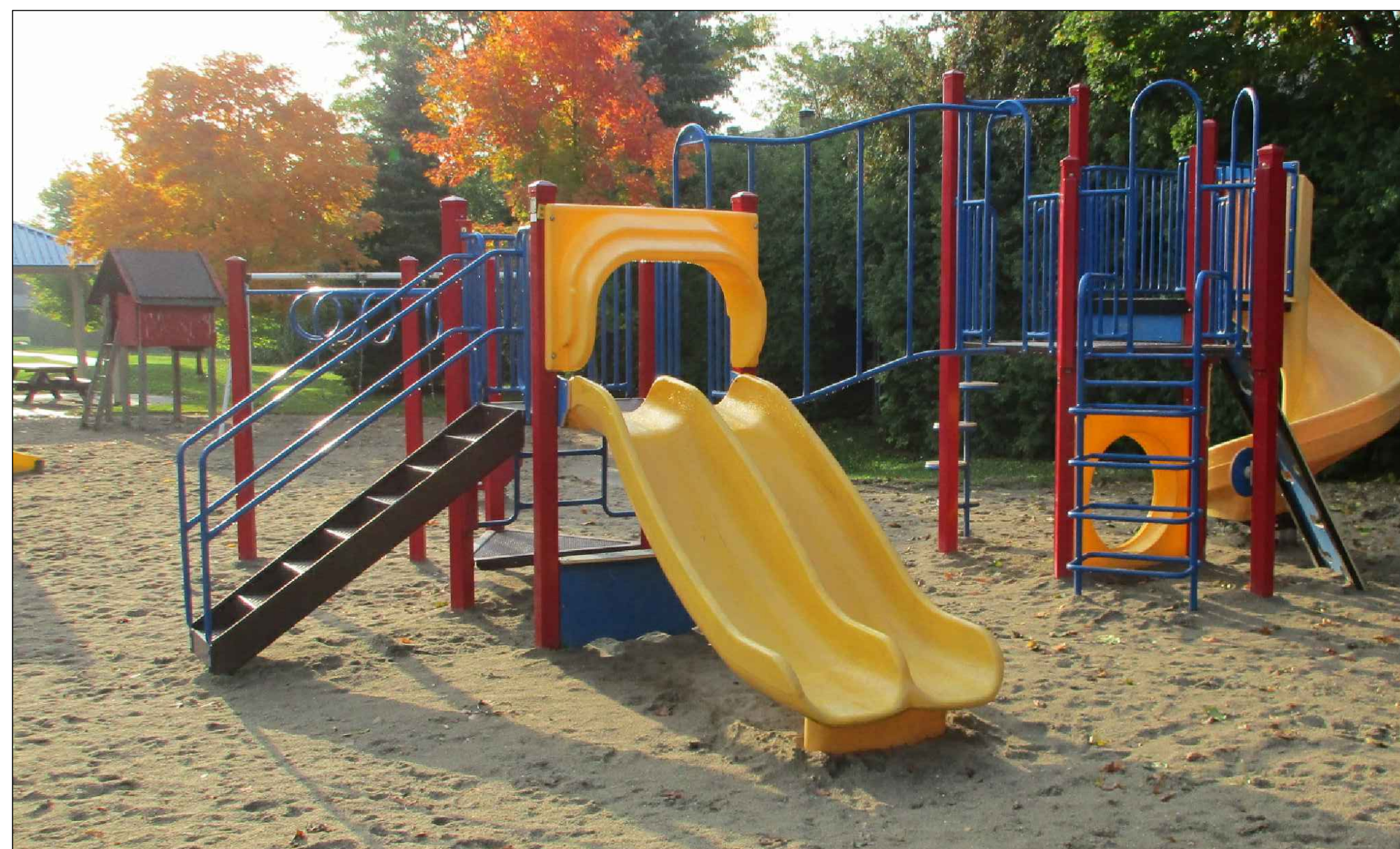
EXISTING SENIOR PLAY STRUCTURE (TO REMAIN) STRUCTURE DE JEU POUR ENFANTS D'ÂGE SCOLAIRE EXISTANTE (À ÊTRE RETENU)