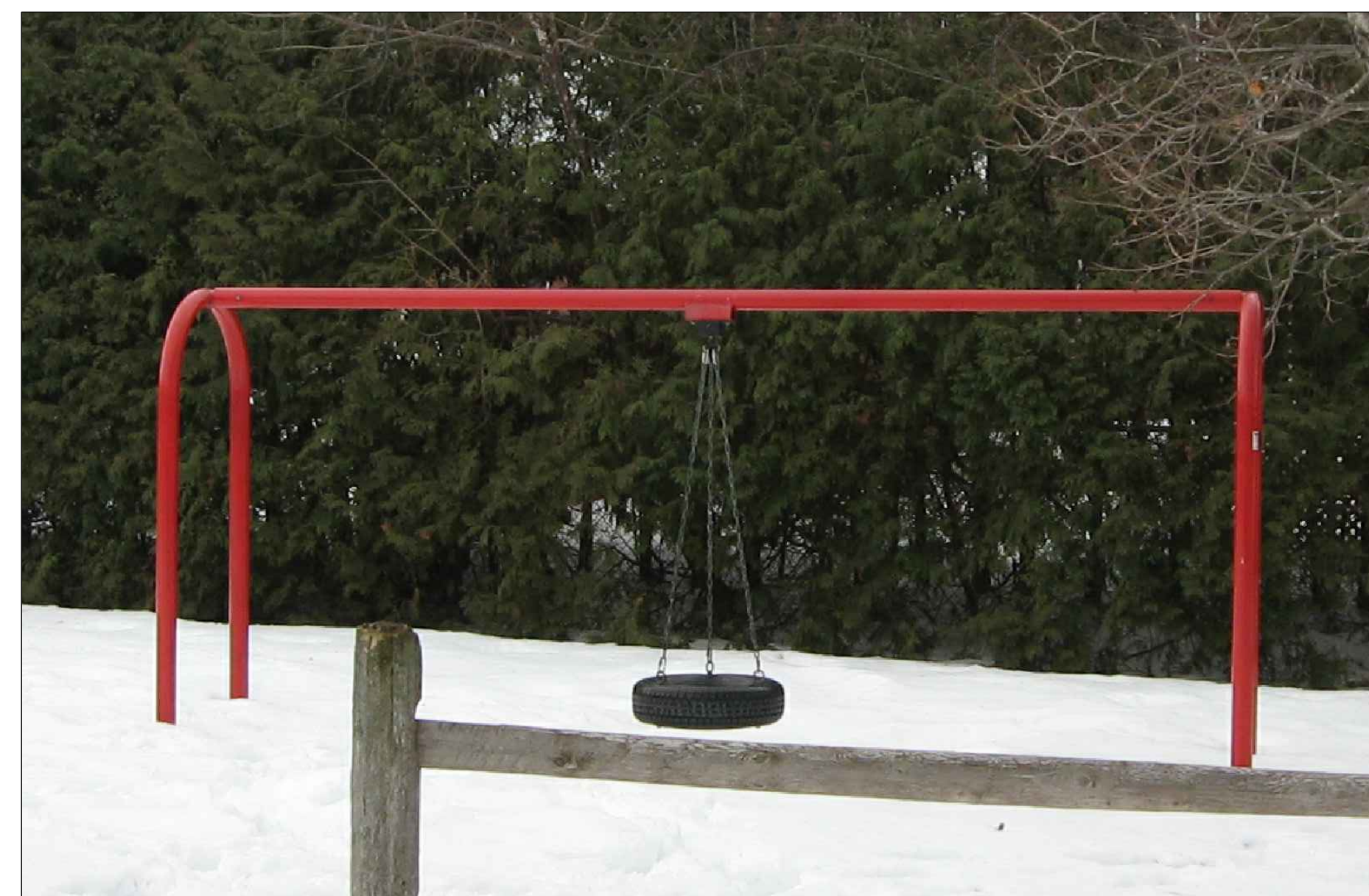
EXISTING TIRE SWING (TO REMAIN) BALANÇOIRE À PNEU EXISTANTE (À ÊTRE RETENU)