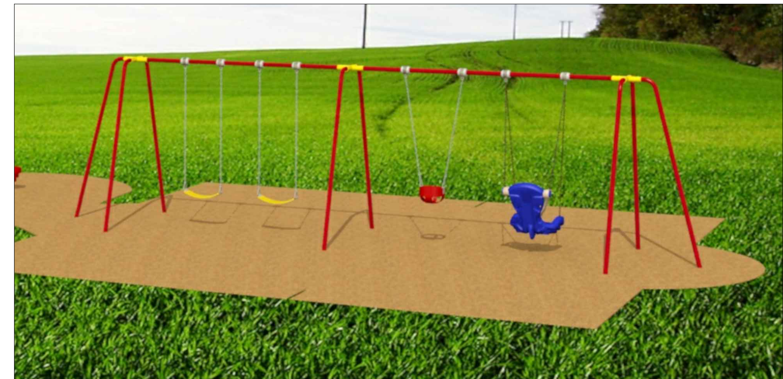
COMBINED JUNIOR / SENIOR SWING SET BALANÇOIRES COMBINÉES POUR ENFANTS D'ÂGE PRÉSCOLAIRE ET SCOLAIRE