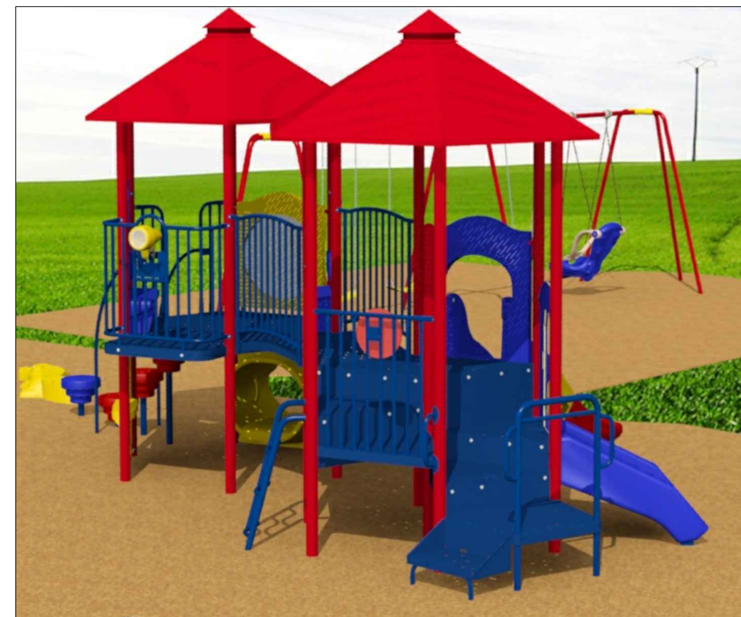
PROPOSED JUNIOR PLAY STRUCTURE STRUCTURE DE JEU POUR ENFANTS D'ÂGE PRÉSCOLAIRE