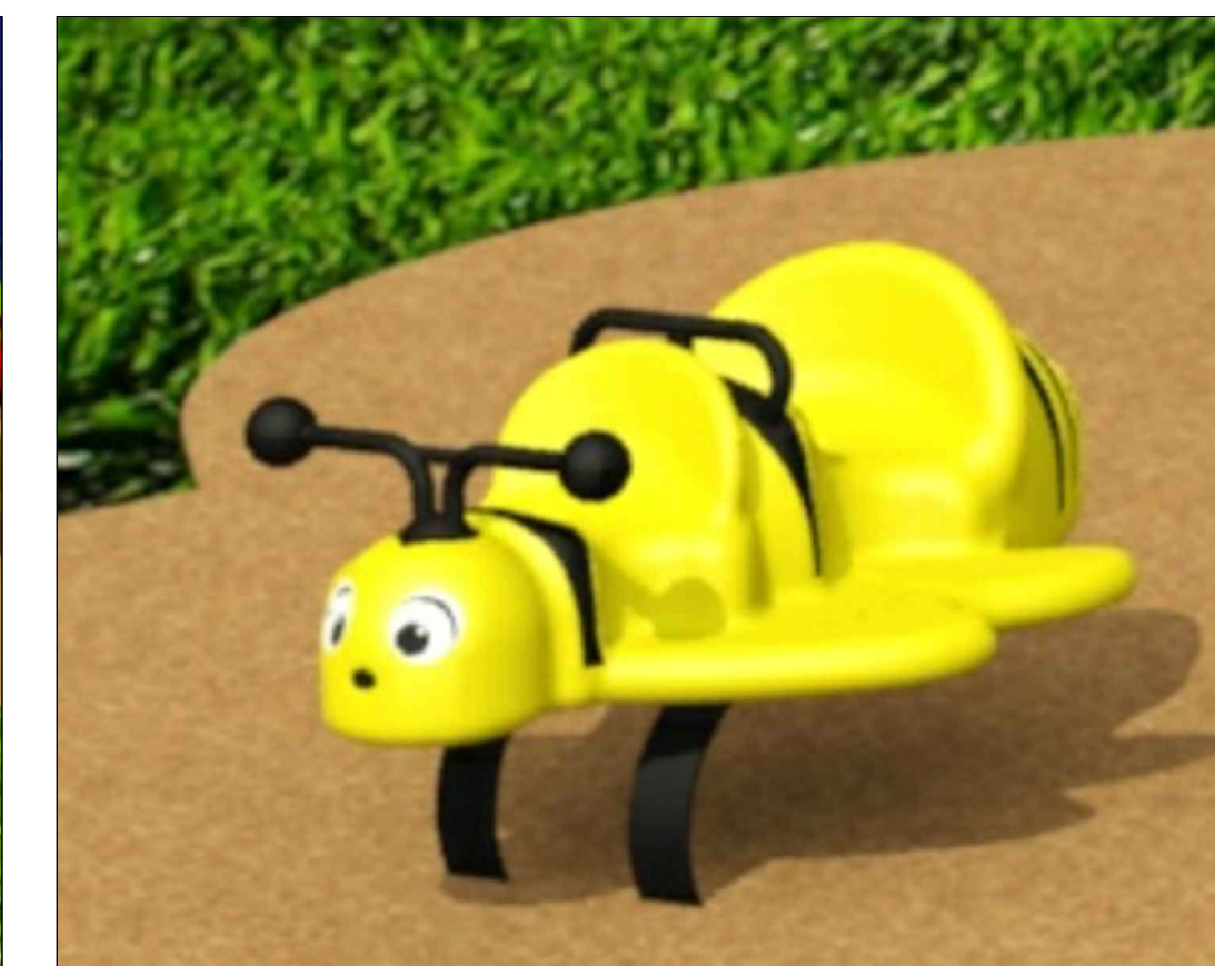
SPRING RIDING TOY JOUET À ENFOURCHER À RESSORT