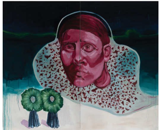
Sharon Van Starckenburg, Murmuration (detail of diptych/ détail du diptyque), 2023, oil on canvas / huile sur panneau, 152 x 183 cm

The term “rewilding” comes from the world of conservation biology and is defined as a progressive approach that enables natural processes to shape human-disturbed (and often damaged) landscapes into healthy, diverse, and sustainable ecosystems. In its simplest terms, it refers to the active transformation from an impacted state to a natural state. The concept of “human rewilding,” recommends conscious undoing of human domestication. Domestication, in this sense, refers to how humans are shaped to become conforming members of society. When viewed through a feminist lens, the term refers specifically to the role girls and women play in a culture structured to benefit and empower men.