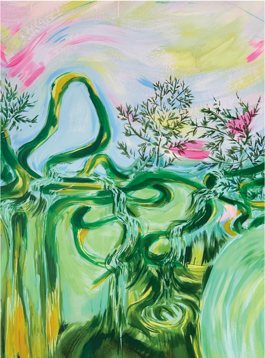
Manon Labrosse, re-wilding (detail/détail) , 2023, acrylic on mylar / acrylique sur mylar, 457 x 228 cm