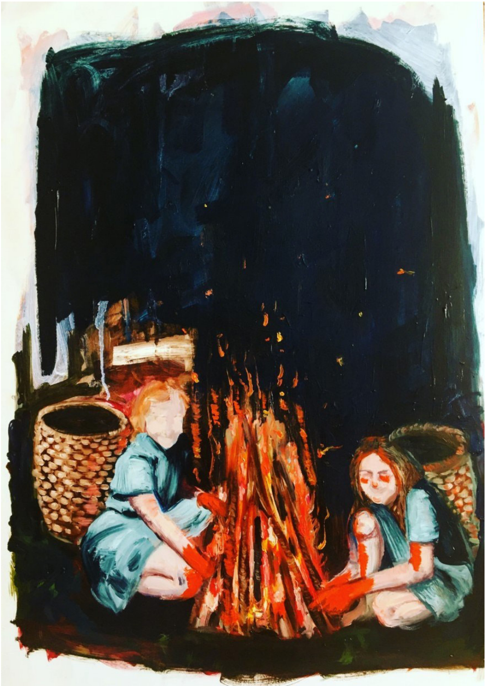
Sharon Van Starckenburg, The Kindling Collectors , 2021, oil on paper / huile sur papier, 64 x 43 cm