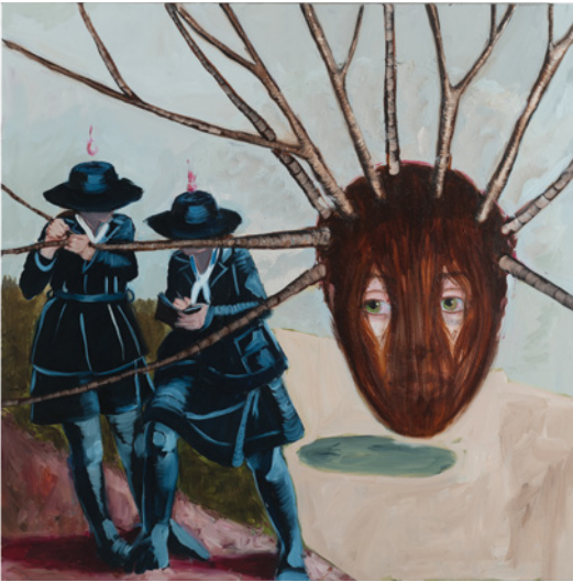
Sharon Van Starckenburg, Wayfinding , 2023, oil on canvas / huile sur panneau, 76 x 76 cm

The Greek myth of Apollo and Daphne, as depicted in Richard Strauss's opera and Ovid's Metamorphoses , tells the story of Daphne, a nymph who prefers to spend her time in the woods. Pursued by Apollo for her notable beauty, Daphne resists the god's advances, despite his claims that he only wants to love her, not destroy her. After Eros (Cupid) gives Apollo wings to help him catch her, Daphne calls out to her father (the river god) to use his powers to destroy her beauty that men seek to possess. Immediately, her skin begins to grow bark, her hair turns to leaves and her arms become branches, ultimately transforming her from human into a laurel tree.