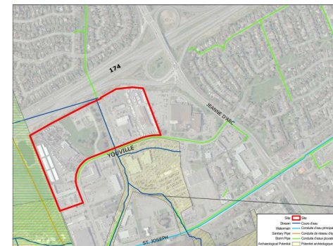
6: Jeanne D'Arc