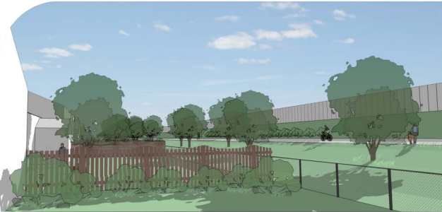
View from Backyard (Typical) / Vue de la cour d'arrière (typique)