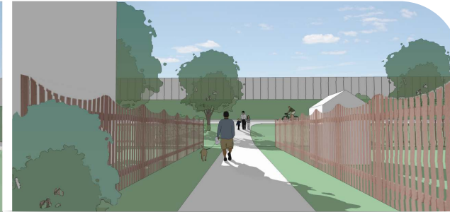
View from Connecting Pathway (Typical) / Vue du sentier de raccordement (typique)