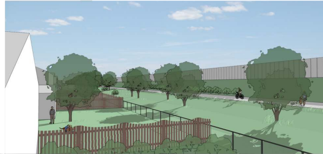
View from Second Floor (Typical) / Vue de la deuxième étape (typique)