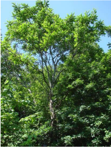
Noyer cendré (au centre)

Aussi appelé noyer blanc. Feuille pennée (dont les folioles sont disposées de part et d'autre d'un axe central, avec une foliole au sommet). Feuilles et rameaux poussant en alternance le long des branches. Noix en forme de lime ou citron, et écale jaune verdâtre duveteuse couvrant une coque brune dure et striée.