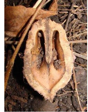
Coque de noix ouverte (sans l'écale)

Le noyer noir, un proche parent qui n'est pas une espèce en péril, produit des noix rondes comme des balles de tennis. Ses feuilles ressemblent beaucoup à celles du noyer cendré, mais la foliole au sommet de chaque feuille est souvent beaucoup plus petite que les autres folioles, voire absente. On peut aussi le confondre avec le frêne au premier coup d'œil, car leurs feuilles se ressemblent beaucoup; les feuilles et rameaux du frêne poussent toutefois en paires opposées plutôt qu'en alternance.