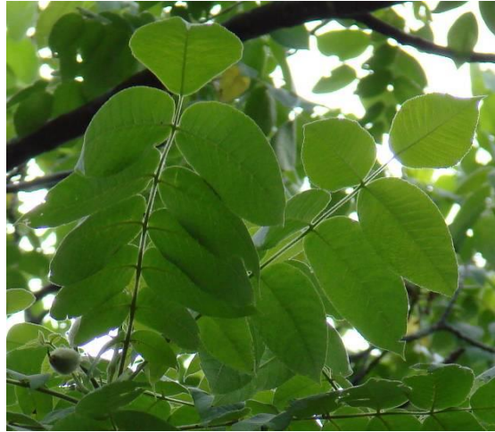
Feuilles et fruit du noyer cendré