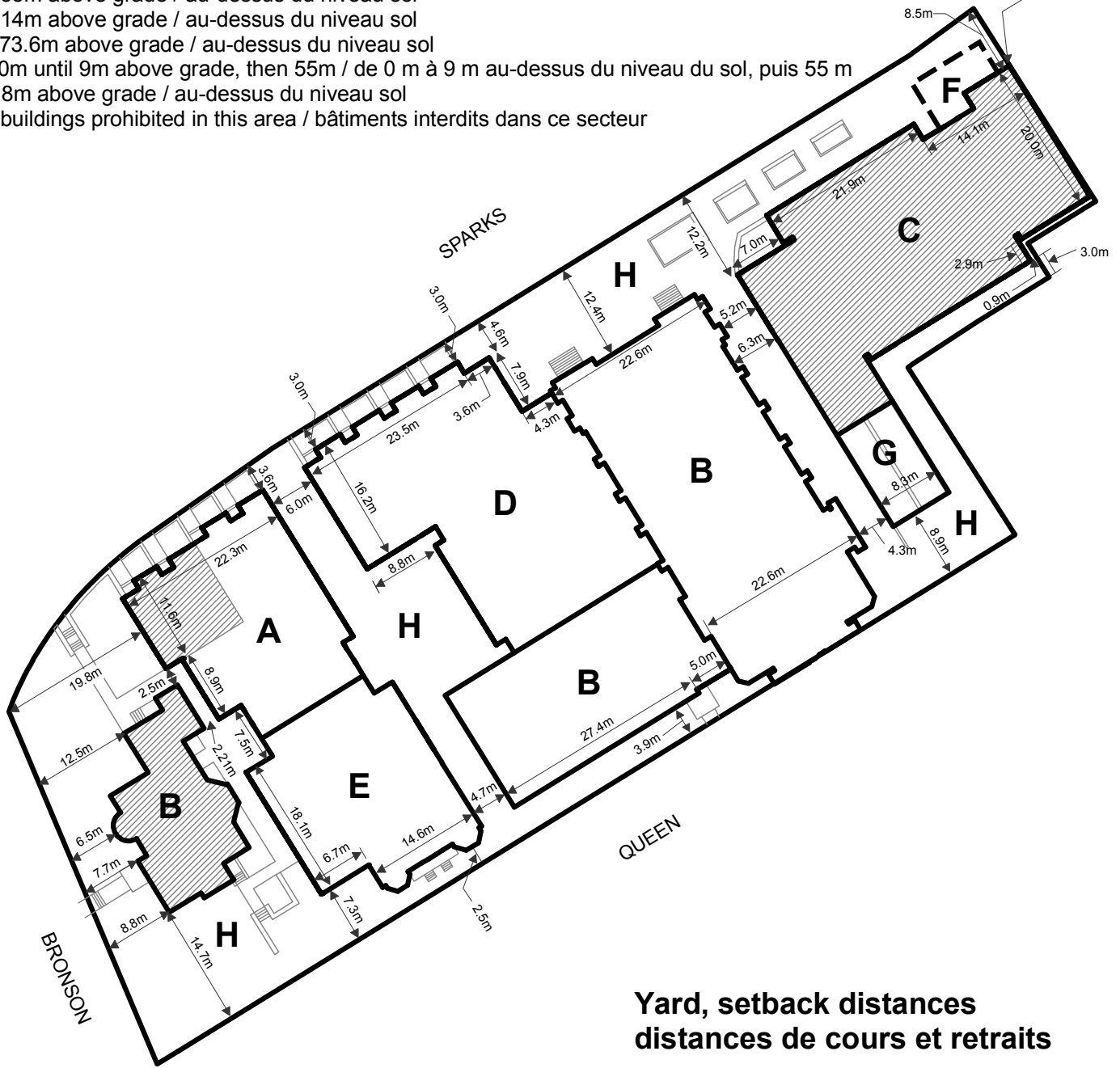
Yard, setback distances distances de cours et retraits

1.1 m to 6.1 m above grade and then 0.6 m 1,1 m à 6,1 m au-dessus du niveau du sol, puis 0,6 m