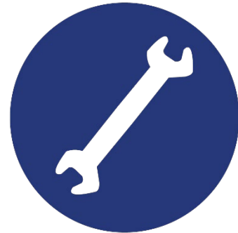
Figure 2 - Exigences relatives aux demandes de service des locataires

Il faut avoir des options permettant aux locataires de demander des services par écrit, à l'oral ou par communication écrite électronique.