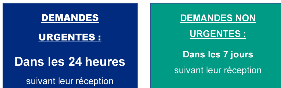
Figure 4 - Délais de réponse

Une demande de service urgente est une demande concernant l'un des problèmes suivants :