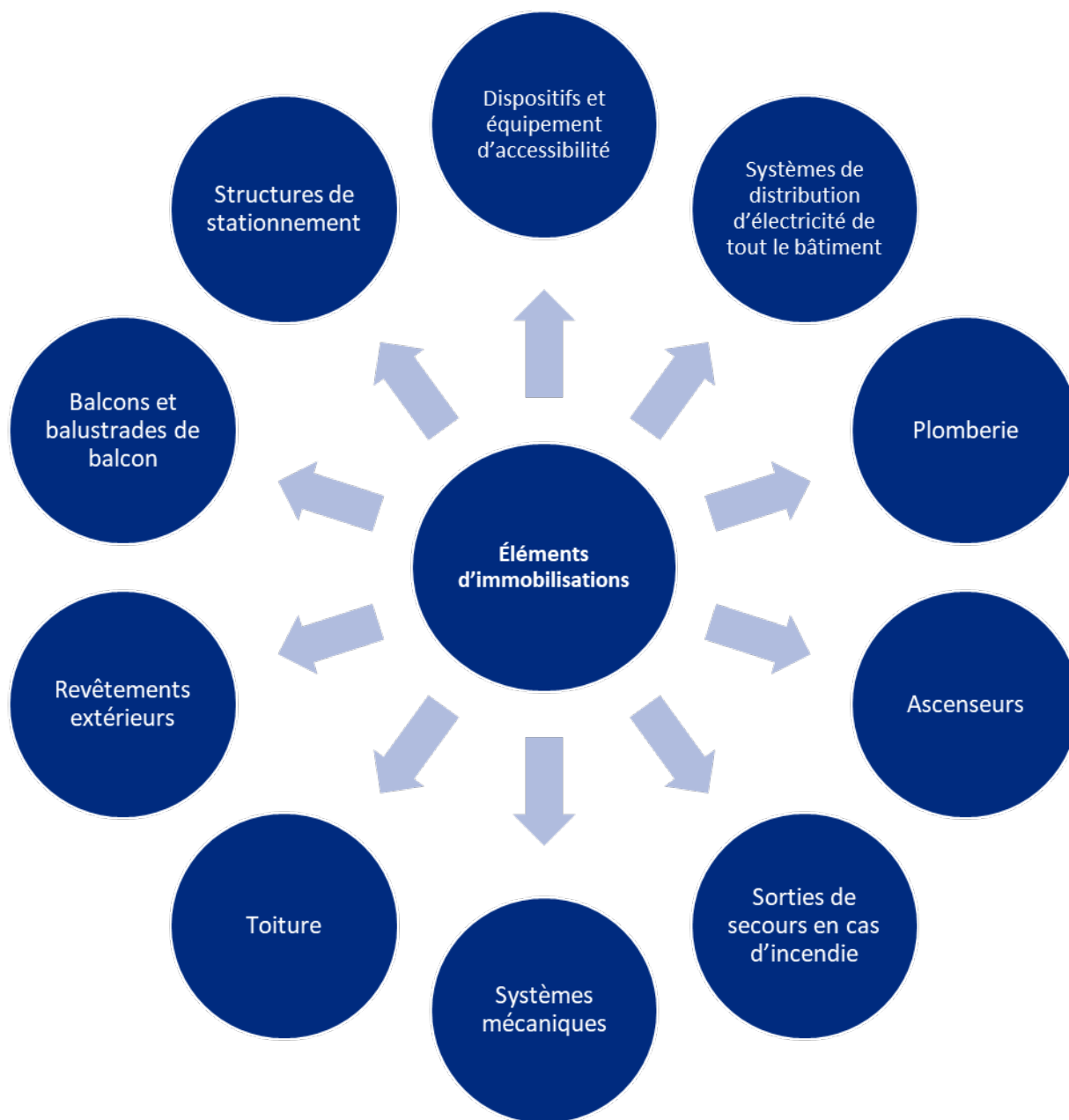
Figure 1 - Ce qu'il faut inclure dans les plans d'entretien des immobilisations