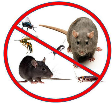
Figure 5 - Plan de lutte antiparasitaire intégrée

Un domaine particulier de préoccupation dans les grands immeubles résidentiels est la présence de parasites. Tout locateur est responsable d'assurer l'entretien de ses logements et de veiller à ce qu'ils soient exempts de parasites.