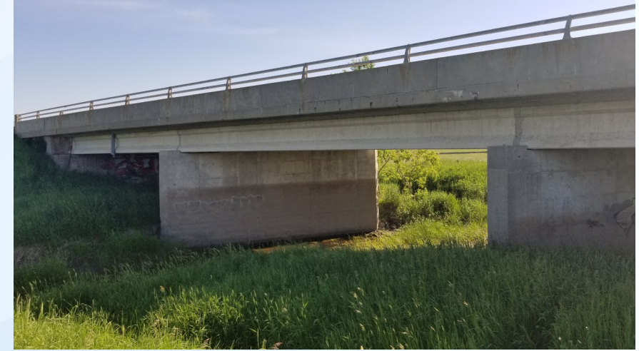
Pont du chemin Milton – Élévation