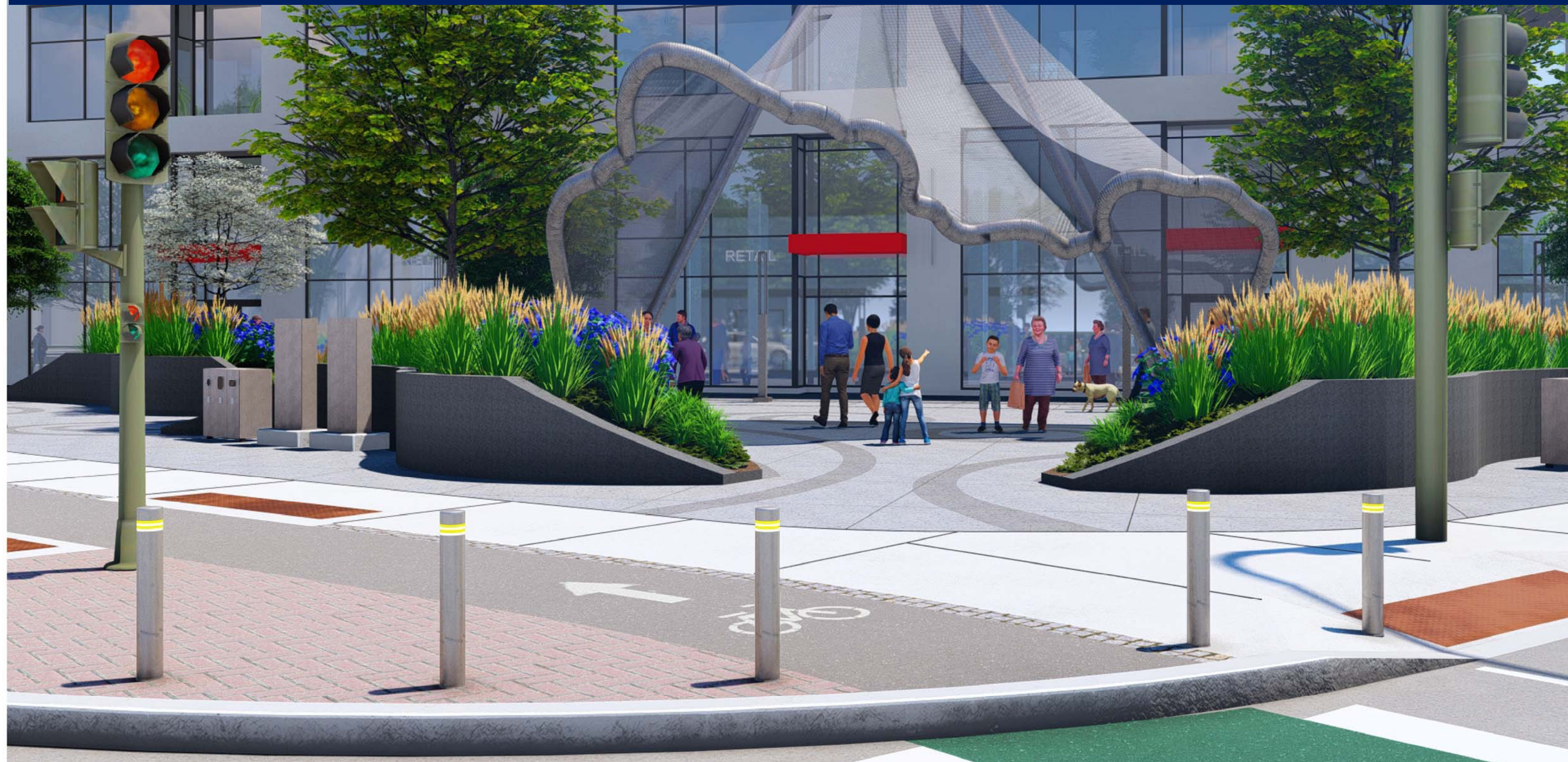
STREET VIEW / VUE DE LA RUE