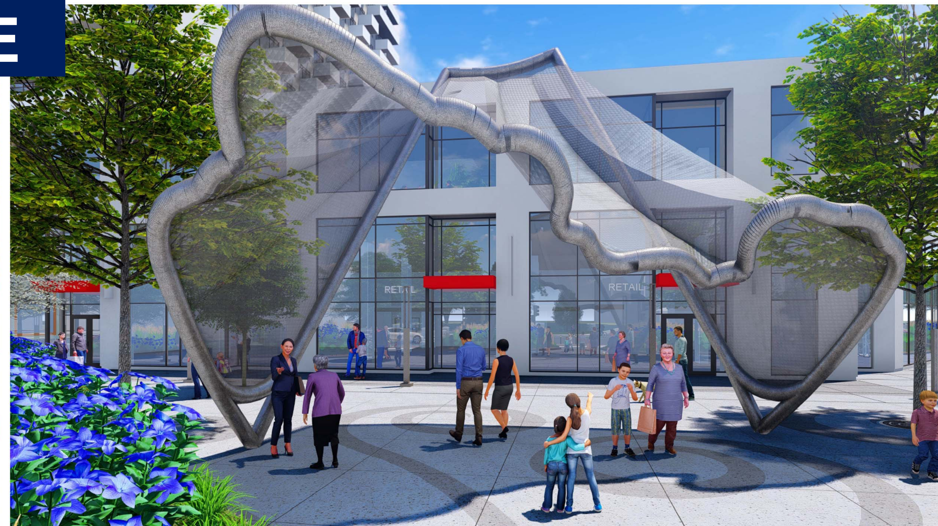
SCULPTURE VIEW / VUE DE LA SCULPTURE