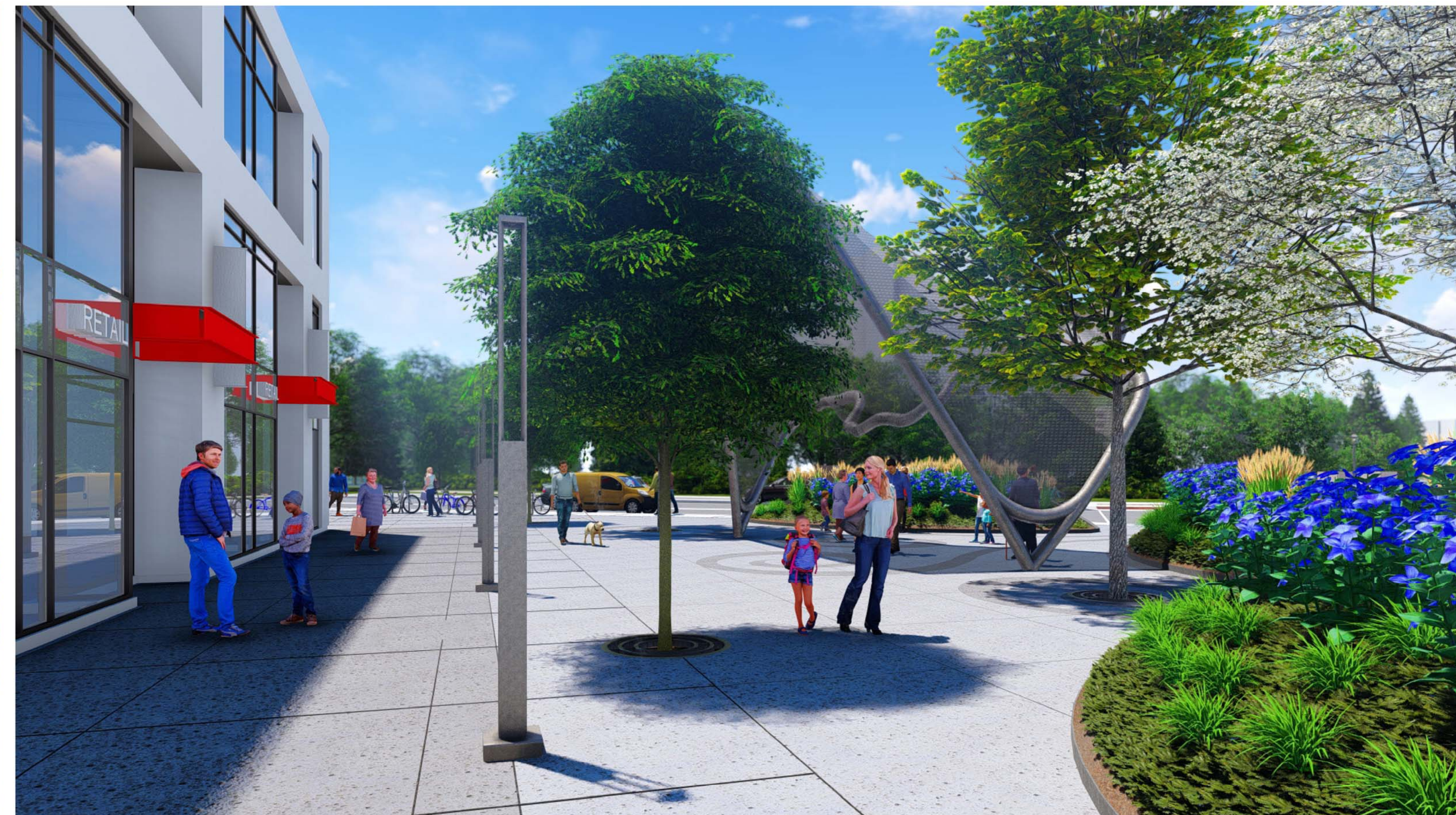
INTERIOR PLAZA VIEW / VUE DE L'INTÉRIEUR L'ESPLANADE