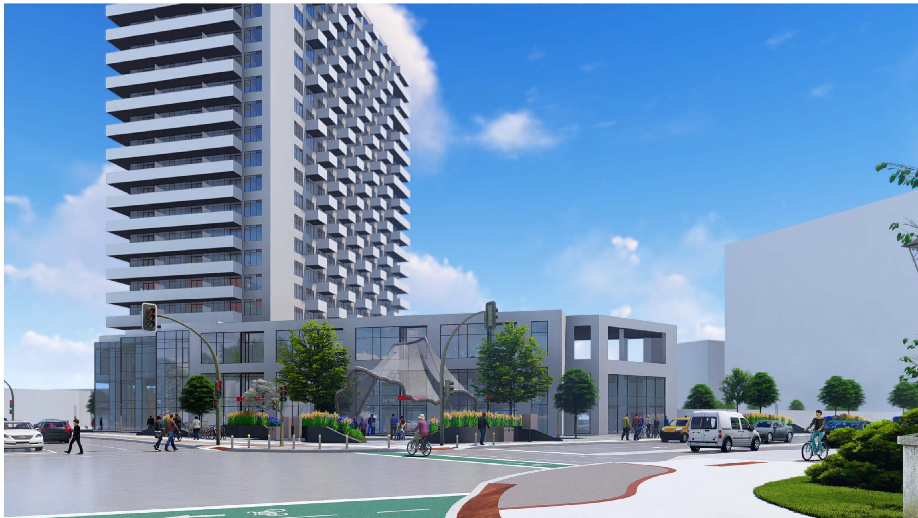
VIEW FROM ACROSS THE STREET / VUE DE L'AUTRE CÔTÉ DE LA RUE