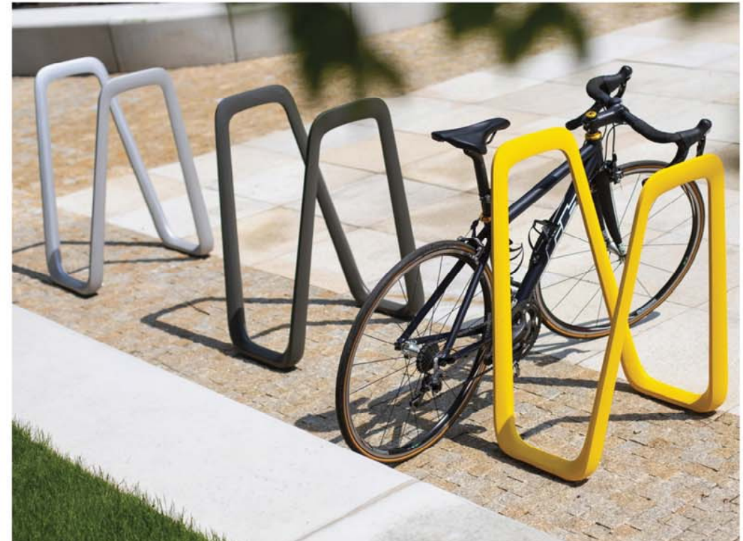
BIKE RACKS / SUPPORTS À BICYCLETTES