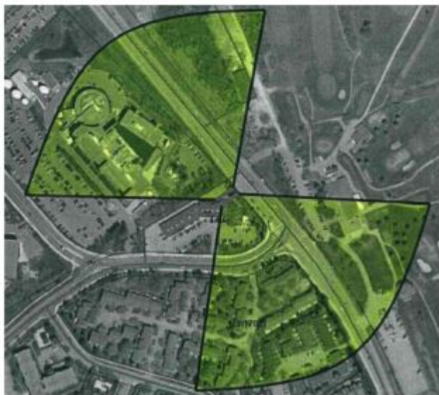
Schéma d'un retrait d'éclairage

retrait d'éclairage – Zone d'impact visuel en forme de cône qui détermine le retrait d'un panneau d'affichage numérique. (light shed setback)